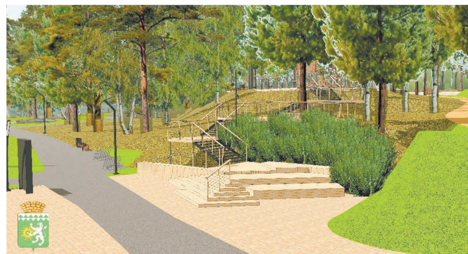
Один из эскизов проекта благоустройства Шилловского парка

С 27 марта начинает работу горячая линия для приема голосов за благоустройство территорий. В будни и выходные с 9:00 до 21:00 можно звонить на единый номер: +7 (343) 289-19-45.