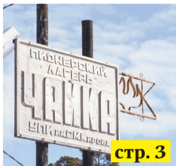
«Чайка» стала нашей