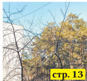
Марта легкое весло