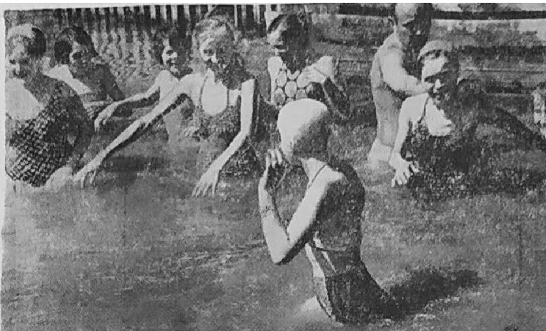
Лето в «Орленке»