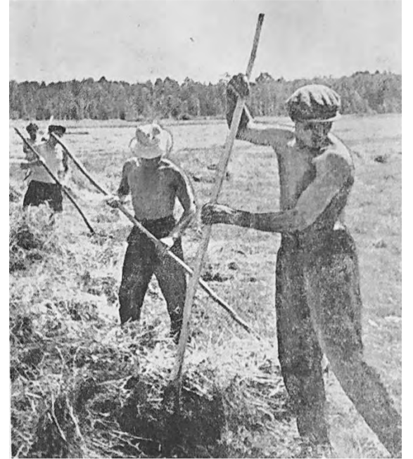
На сенокосе горняки

Особенно трудно в 1965 году давался сенокос. Руководство подсобных хозяйств советовало, что предприятия-шефы направляли в помощь колхозникам рабочих, не имеющих сельскохозяйственных навыков, да еще и в недостаточном количестве. Работа бригад была организована плохо, трудовая дисциплина хромала: на покосе не редкость выпивки, в воскресные дни рабочие разъезжались по домам, теряя драгоценное время и благоприятную погоду (12 июля половина рудничных рабочих сидела без работы в ожидании команды старшего, а вся сводная бригада в 12 часов, узнав, что обед не приготовлен, уехала в Берёзовский – 15 человек за одной поварихой!). Но не все так наплевать-