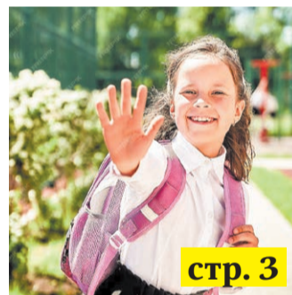
В понедельник – в первый класс