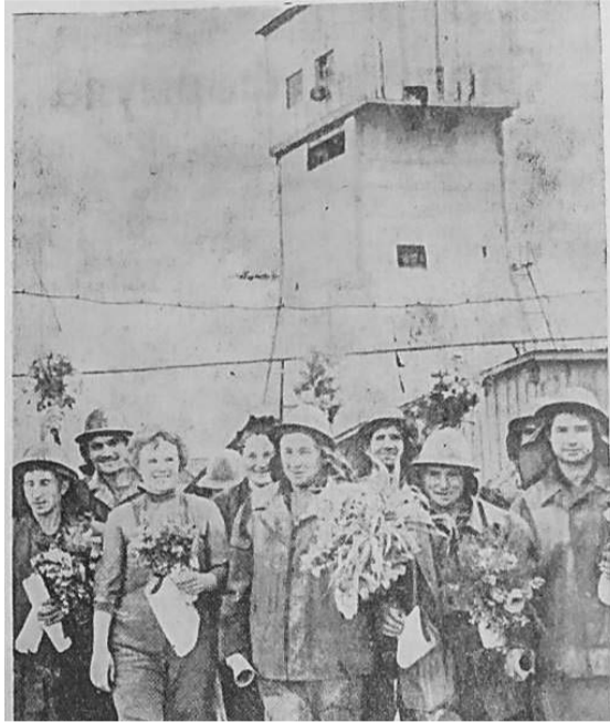
Скоропроходческая бригада шахты Северная

28 июня на берегу Шиловки прошёл городской слёт юных путешественников – 14 команд (а это 300 человек!) из школ города и поселков подводили итоги краеведческой и туристической работы. Три дня длился слёт: соревнования по ориентированию, конкурсы юных геологов и биологов, санитарная эстафета, конкурс поваров, фотоотчеты о походах, выставки минералов и гербариев и снова конкурсы – на лучший лагерный быт, литераторов, соревнование по маркированной трассе... Все победители соревнований и конкурсов получили памятные подарки, призы и почётные грамоты. Завершая свой большой репортаж, начальник слёта А. Петров отметил, что «туристическими походами и экскурсиями охвачено в этом году 5800 человек. В нашем городе теперь 4 тысячи ребят имеют значки «Юный турист», 500 – «Турист СССР» и 150 участникам турпоходов присвоен второй разряд по туризму».