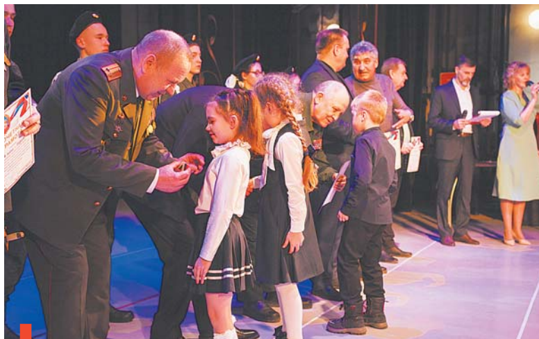
Медаль «Мой папа – Герой!» вручается детям от рождения до 18 лет и старше