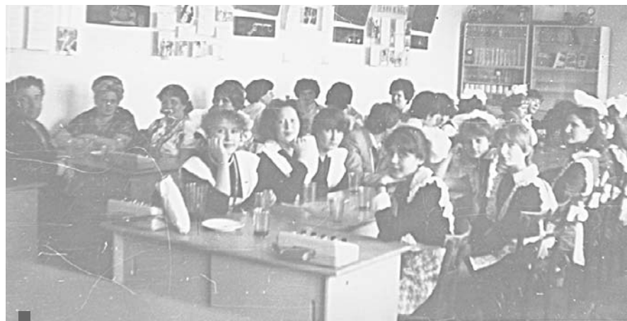
Выпускной 10 класса в кабинете физики в школе №1, 1980-е

Говорила я негромко, и в классах всегда была тишина. Меня как-