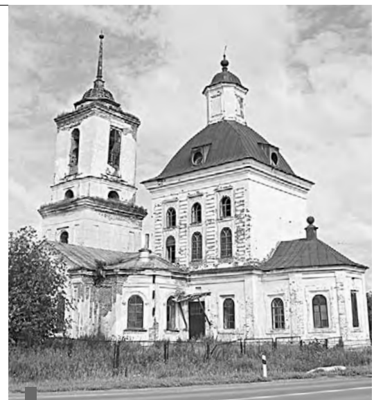
Храм в с. Новопышминском – свидетель истории, описанной П. Бажовым

Давайте прочитаем этот очерк и прикоснемся к событиям 1918 года, когда революционные перемены захватили жизнь уральской глубинки на берегах Пышмы. Текст приводим в сокращении, полностью смотрите его в упомянутой книге П. Бажова на сайте archive.org.