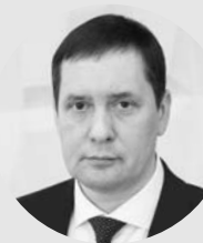
Рафаил Мингалимов, Глава городского округа Сухой Лог:

– Явка сухоложцев на выборах Президента РФ стала беспрецедентной за всю 30-летнюю историю избирательной системы Российской Федерации. Она существенно превысила значения предыдущих президентских кампаний и составила 71,36% от числа всех избирателей. Такие показатели – отражение заинтересованности граждан в завтрашнем дне, в будущем России.