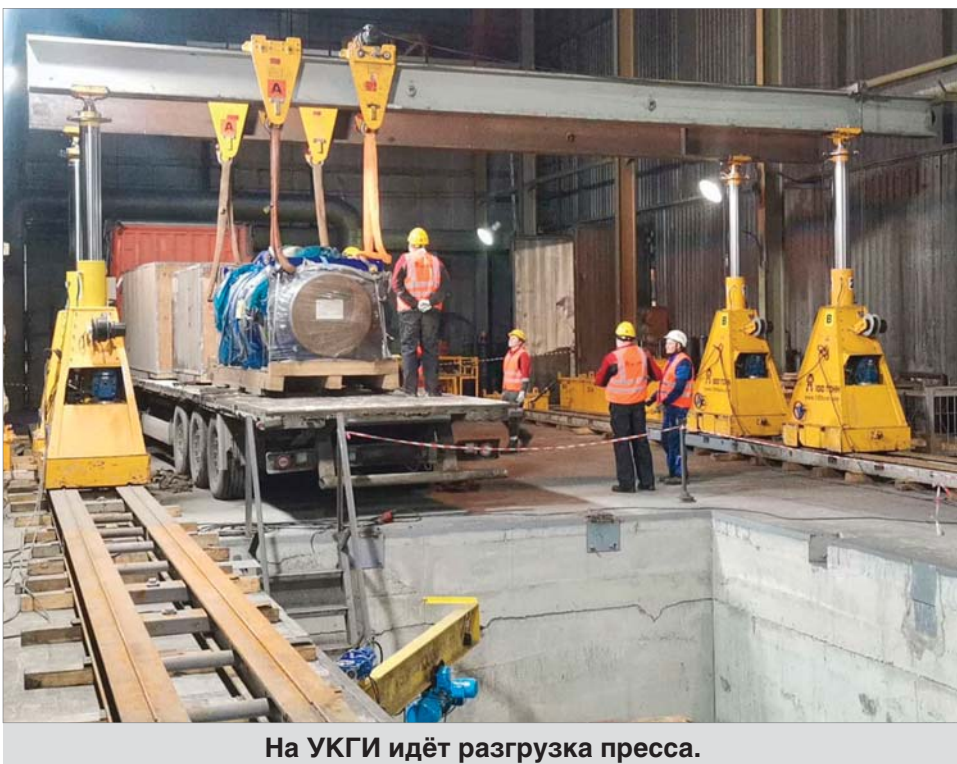
На УКГИ идёт разгрузка пресса.

И вот эта машина – на заводе. Доставку изостата осуществило ООО «Эрствак», начальник сервисной службы которой тоже был в команде с нашими инженерами в той январской командировке. Март – время монтажа пресса и фоторепортажей с главного заводского объекта.