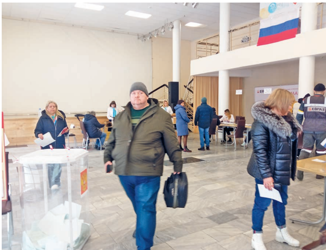
Основной поток избирателей прошёл в первый день голосования