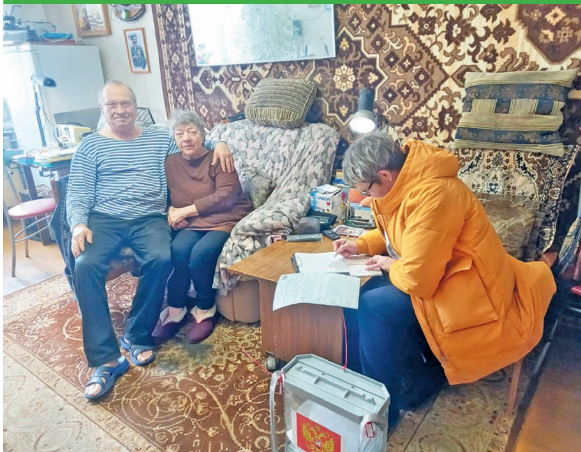
Члены избирательных комиссий собирали голоса по домам

«коктейля Молотова». Девушка была задержана.