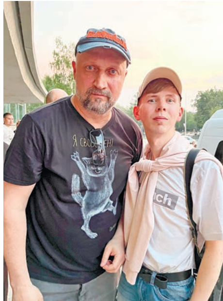
... с Гошей Куценко