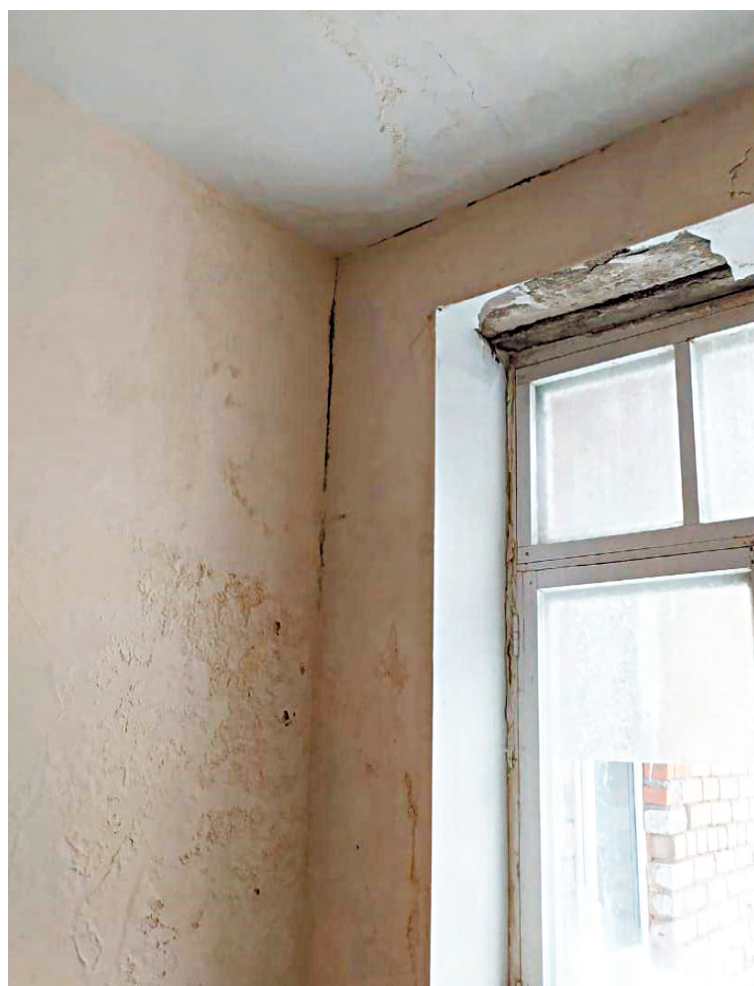
Внутри здания грибок

Не зря обратилась ко мне независимая газета «Новый Качканар» с просьбой рассказать о моей работе смотрителя за зданиями. Многие я могла бы рассказать о том, как радиозавод выполнял поручение от города — шефскую работу по ремонту больничного городка. В частности, ежегодный косметический ремонт родильного отделения в двух зданиях. После того, как «почил» радиозавод, больницу