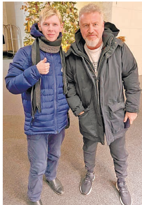
... с Леонидом Агутиным