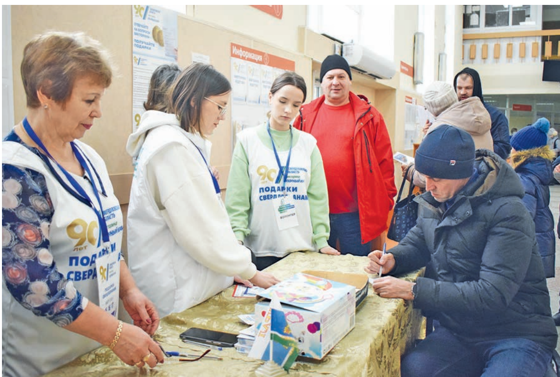
В Свердловской области на участках проводилась юбилейная викторина

Студентка из Асбестовского политехникума пришла к школе №21 в Асбесте и кинула бутылку с зажигательной смесью в сторону входа. Пожар быстро потушили огнетушителем. По данным Shot, мошенники пообещали девушке перевести за поджог избирательного участка 150 тыс. рублей, однако отправили 2,5 тыс. рублей на составляющие для