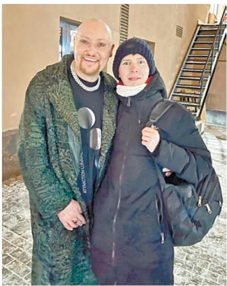
... с Шурой