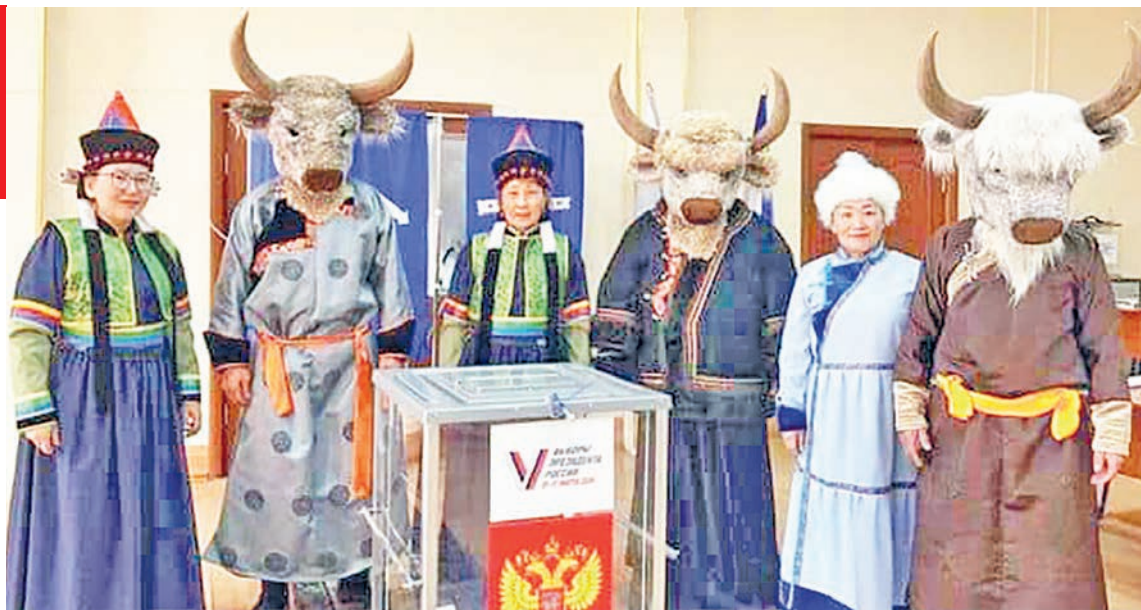
Кто только не приходил голосовать

Почти 3 тысячи свердловчан, участвовавших в ДЭГ на выборах президента, отправили пустые бюллетени. Всего явка на ДЭГ составила 95% от числа зарегистрировавшихся избирателей. При-