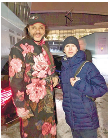
... с Филиппом Киркоровым