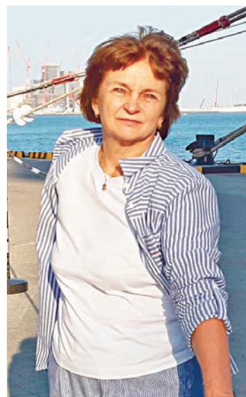
Неожиданное путешествие в середине зимы

ной окраски. Но я почему-то ожидала большего. А вот знаменитый отель «Парус» и остров «Пальма» не вдохновили меня так, как в первый раз.