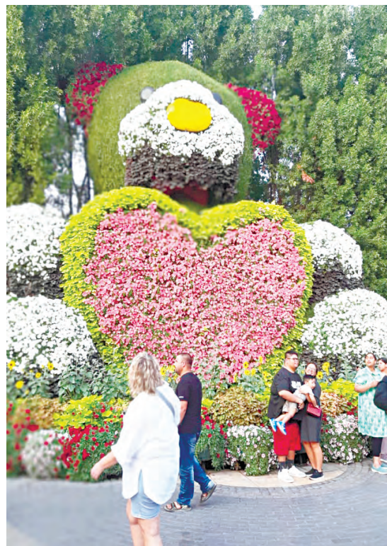
Сад цветов в Дубае восхищает и завораживает

из семи Эмиратов, которые объединились в 1971 году. До этого времени все воювали между собой за место под солнцем, за воду и т.д. Довоевались до того, что осталось всего 30% мужского населения. После войн стали строить государство, которое процветает и по сей день.