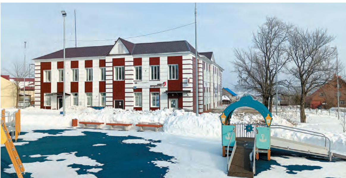
В здании по улице Революции, 110А, теперь будет располагаться Бисертский филиал колледжа имени Демидовых