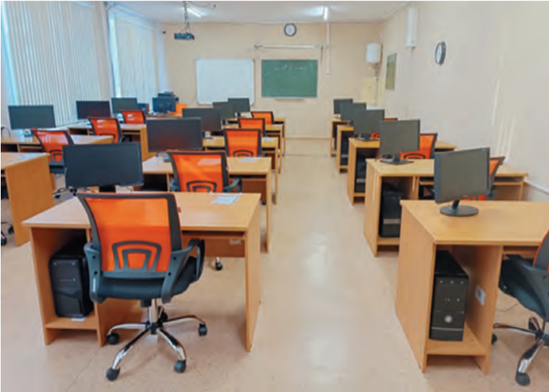
Новый компьютерный кабинет в Бисертской средней школе №2

В ходе своего традиционного Послания Федеральному Собранию Владимир Путин обозначил в каком направлении будет развиваться отечественное образование – и многое из сказанного Президентом уже несколько лет реализуется в Свердловской области.