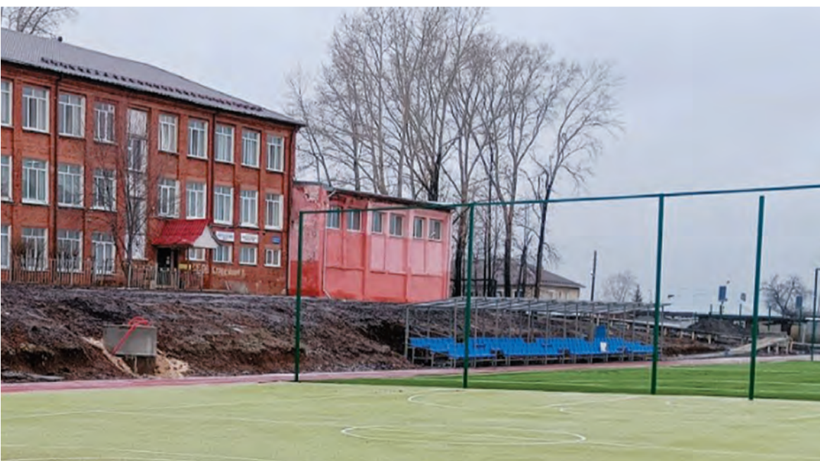
Новый стадион для Бисертской спортивной школы