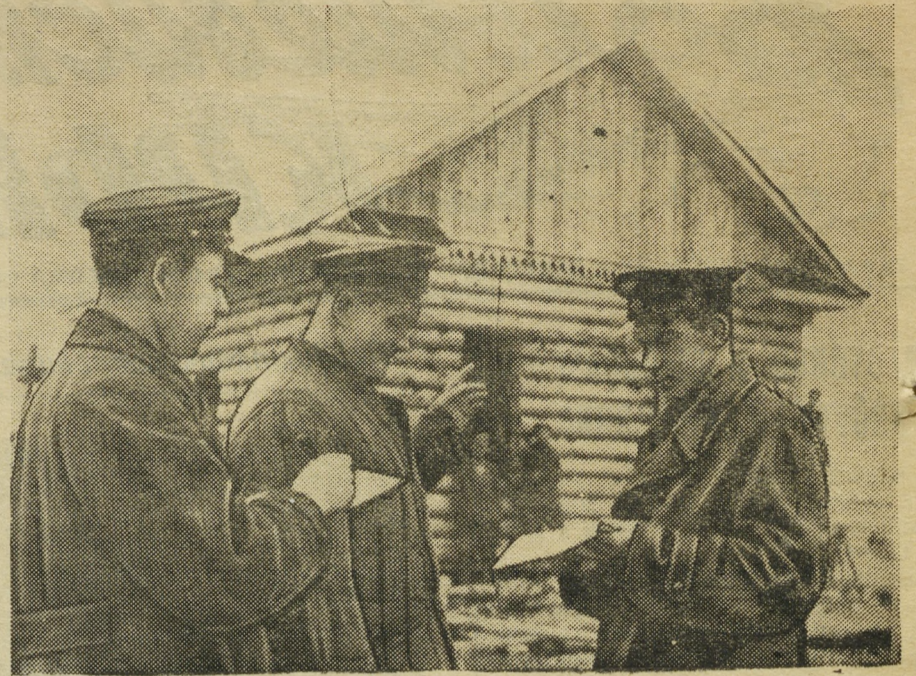
Работники Тюменского аэропорта готовятся во всеоружии встретить сибирскую зиму. Недавно здесь сдан в эксплуатацию новый дом, предназначенный для технической бригады.

Номер от 5 августа, например, вышел под лозунгом «За мир во всем мире!». Здесь и яркие карикатуры, изобличающие поджигателей новой войны, и привлекательные заголовки, и короткие, выразительные заметки.