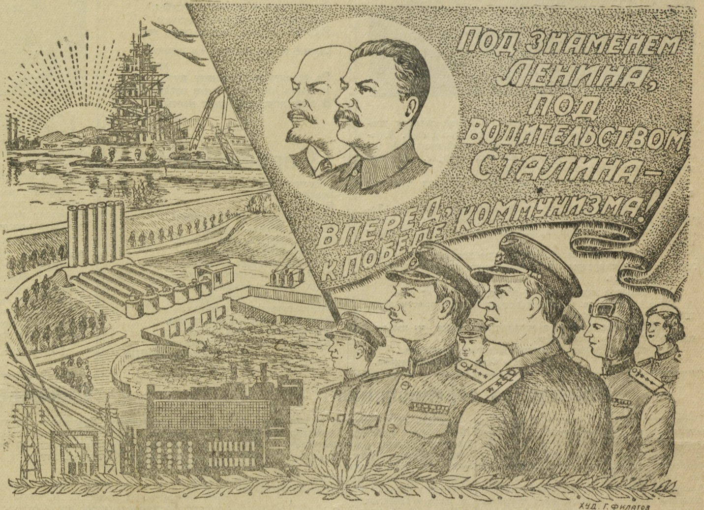
Худ. Г. Филиатов

Под знаменем Ленина, под водительством Сталина — вперед, к победе коммунизма!