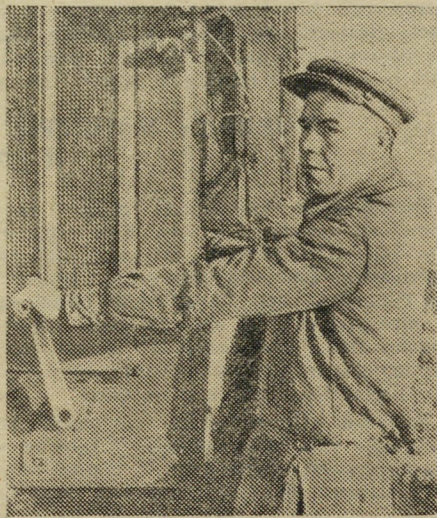
опыт обогатился. Он отлично эксплуатирует свою машину, бережно обращается с ней.

С той поры, вот уже четвертый год, Кузнецов работает в порту. За это время он значительно повысил свои знания, его