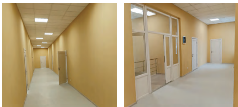
Так обновлённое здание выглядит изнутри

люку, а также активной помощи от губернатора Евгения Куйвашева , Министерств ЖКХ и Образования Свердловской области и лично министров – Николая Смирнова и Юрия Биктуганова – Бисерти удалось получить финансирование на капитальный ремонт здания.