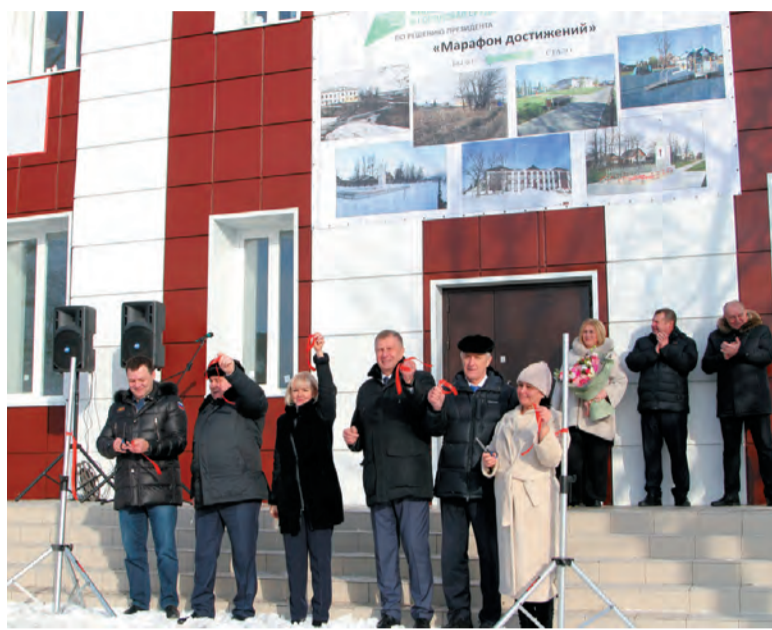
Открытие административного здания по улице Революции, 110А