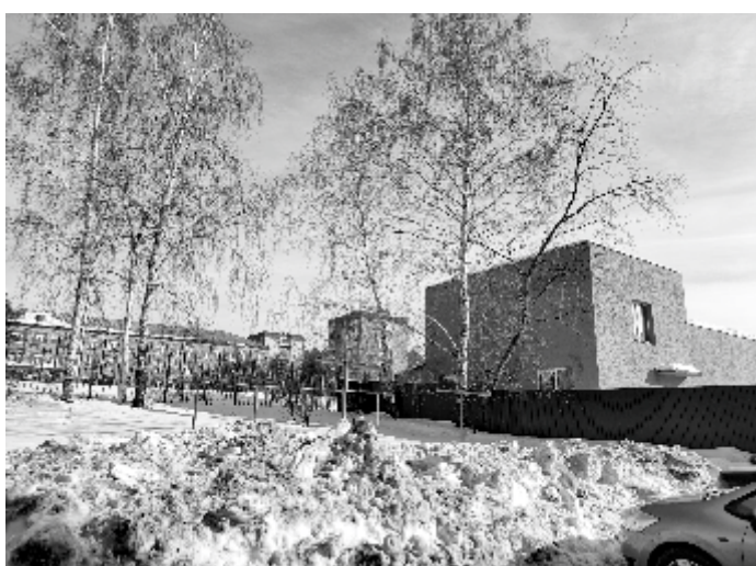
Малозаметная постройка между школой №2 и домами продается за 23 млн рублей

Самым дешевым предложением оказалась многострадальная канализационно-насосная станция на базе ОРСА, стоимость объекта - 500 тысяч рублей.