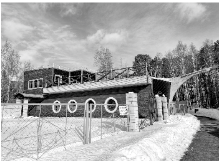
Кафе-корабль не могут запустить с 2008 года

Говорят, что в Заречном не хватает площадок для развития. Мы решили посмотреть, какие коммерческие объекты сейчас продаются в Заречном. К нашему удивлению, если верить сайту «Авито», то вариантов в Заречном действительно немало: всего 28... Зато многие выставленные объекты имеют весьма любопытную историю.