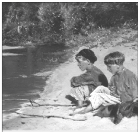
Картина Владимира Маковского