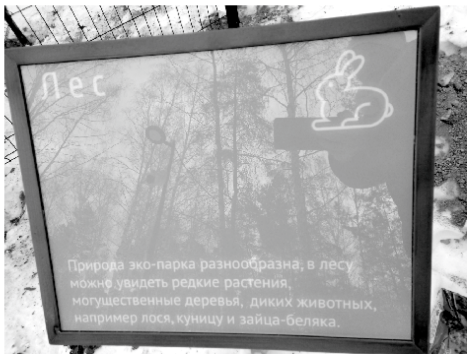
Алёна АРХИПОВА, Фото автора

- Лось, куница и заяц-беляк, действительно, водятся в наших лесах.