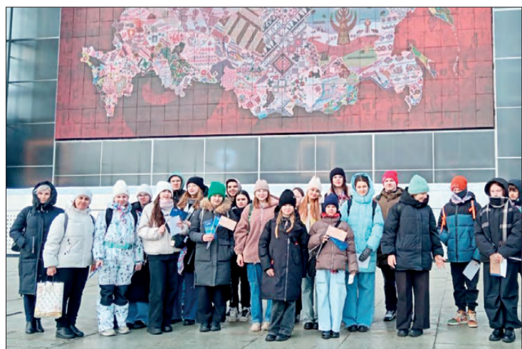
Делегация Свердловской области на выставке «Россия»