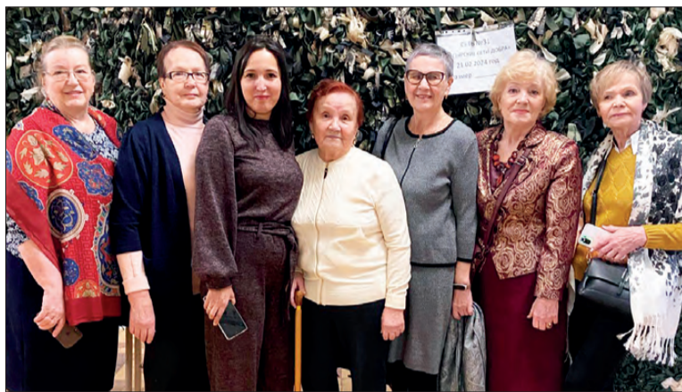
Активисты объединения «Дегтярские сети добра»

Огромные покрывала плетутся руками этих ангелов-хранителей. Когда бы ни зашел в фойе Дворца, около стойки (рамы