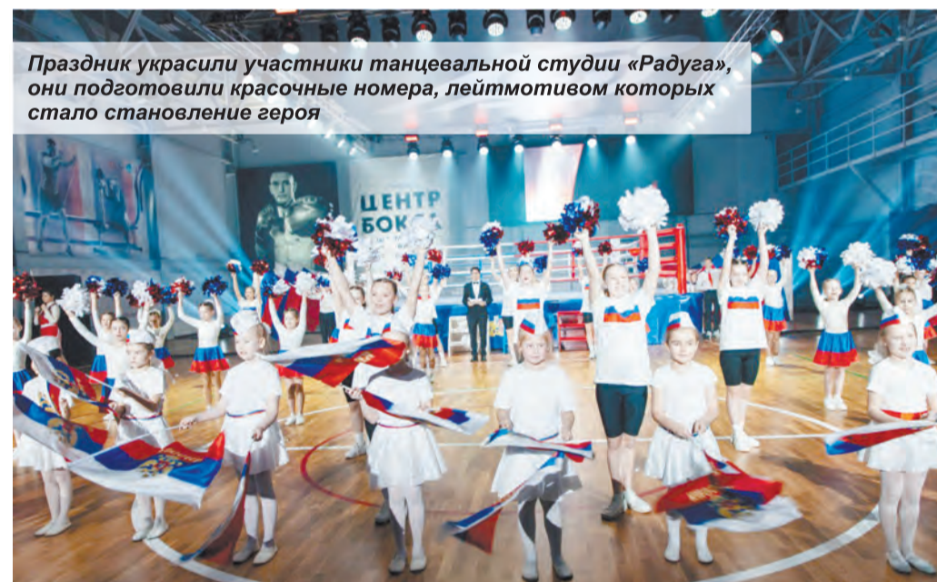
Праздник украсили участники танцевальной студии «Радуга», они подготовили красочные номера, лейтмотивом которых стало становление героя