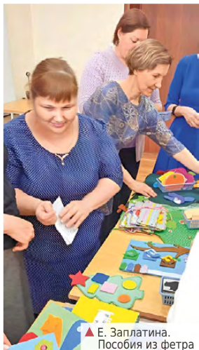
▲ Е. Заплатина. Пособия из фетра

Управление образования совместно с Информационно-методическим центром провело интерактивную выставку развивающих пособий «Научи меня, мама», в которой приняли участие 39 мам. Этот проект, представляющий множество пособий и игр, стал настоящей образовательной практикой для родителей и педагогов.