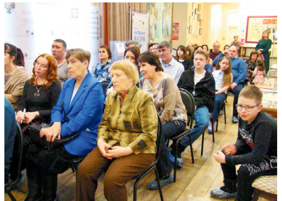
▲ Зрители с большим вниманием наблюдали за участниками программы