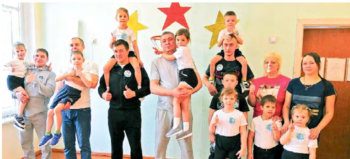
▲ Команда «Золотые ключики»

«Мы танкисты, рвемся в бой! Танк – любимый наш герой!» – под таким девизом в детском саду №42 прошли спортивно-игровые соревнования, посвященные Дню защитника Отечества.