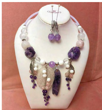
▲ Стильный комплект