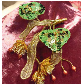
▲ «Липовый цвет»