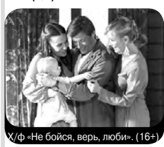
Х/ф «Не бойся, верь, люби» (16+)