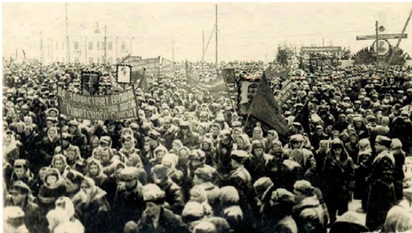
▲ Траурный митинг по случаю смерти И.В. Сталина, 8 марта 1953 г.

Площадь Октябрьской революции. Траурный митинг по случаю смерти великого и любимого вождя Советского Союза тов. И.В. Сталина.