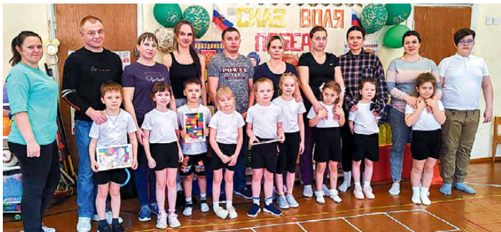
▲ Команда «Теремок»