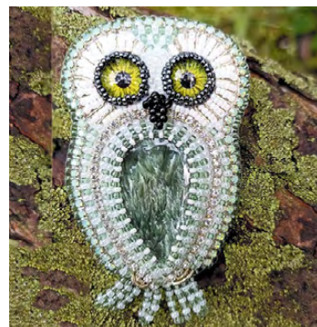
▲ Броши: «Совушка»