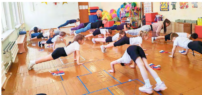
▲ Команда «Теремок»