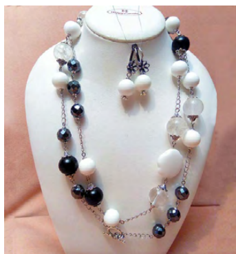
▲ Кольцо и серьги

Ольга СИМОНОВА