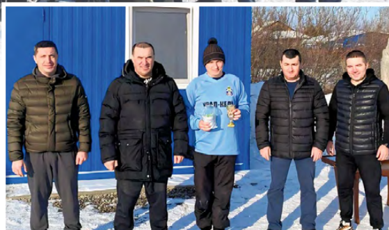
▲ Награждение лучшего вратаря