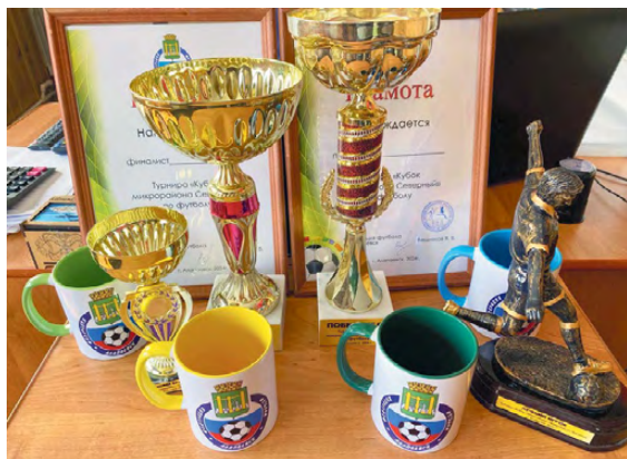
▲ Награды и призы участникам турнира

В мероприятии участвовали игроками и в дальнейшем приняли участие в награждении ко-