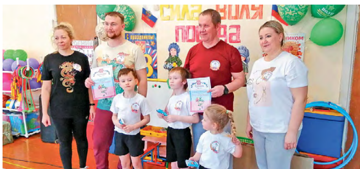
▲ Команда «Смешарики»

кам необходимо было провести свой танк по всей дистанции как можно быстрее. Атмосфера эстафеты была очень напряженной, ведь соревновались сильные соперники. Все старались изо всех сил быть первыми.