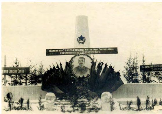
▲ Траурный мемориал по случаю смерти И.В. Сталина

Ему были присвоены звания Героя Социалистического Труда (1939), Героя Советского Союза (1945), Маршала Советского Союза (1943), высшего воинского звания – Генералиссимуса Советского Союза (1945). Он награжден 3 орденами Ленина, 2 орденами Победы, 3 орденами Крас-