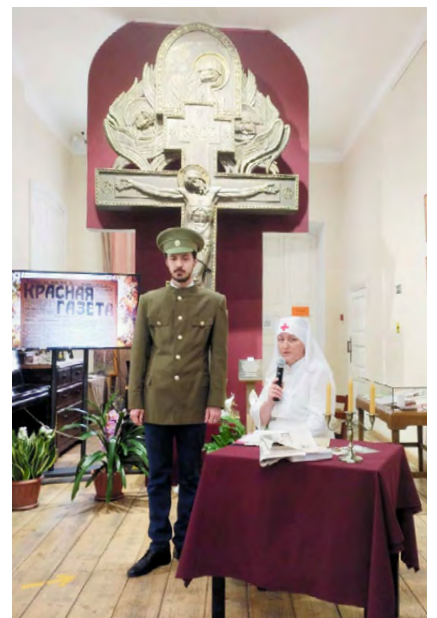
▲ Иоанн Константинович и Елена Петровна в исполнении сотрудников музея