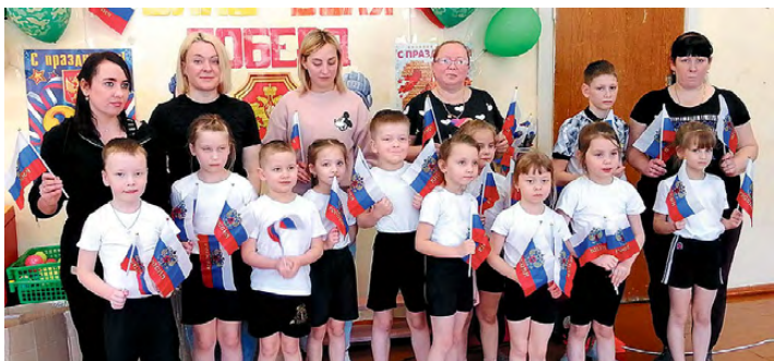
▲ Команда «Непоседы»

Вторая, «армейская», часть игровой программы «Я танкистом смелым буду, проведу свой танк повсюду!» была посвящена 81-й годовщине формирования УДТК. Ребята узнали о том, что у танкистов есть основные специальности: механик-водитель, оператор-наводчик орудия и командир танка. Первое испытание было для механика-водителя. Игро-