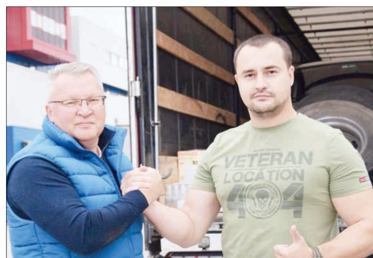
ционных действий, целей и задач, налаживалось взаимо-

шлом году «заливался фундамент», проводилась работа по систематизации организа-