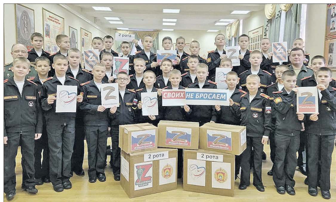
ЕкСВУ. В самом же училище не первый месяц проводится акция на первенство подразделений по сбору макулатуры.

Что касается макулатуры, то и она сегодня в буквальном смысле в цене. Её собирают в училище все — от суворовцев первого курса до офицерского состава.