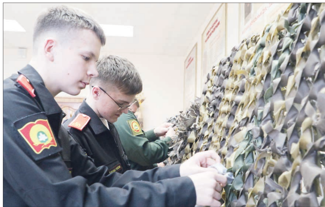
Командование Екатеринбургского суворовского военного училища показало работу воспитанников, которые по зову сердца плетут маскировочные сети.

пожеланиями сил, здоровья и скорейшего возвращения домой с победой. В рамках Всероссийской акции «Тепло для героя» юные патриоты из Троицкой школы вложили в посылки для бойцов СВО