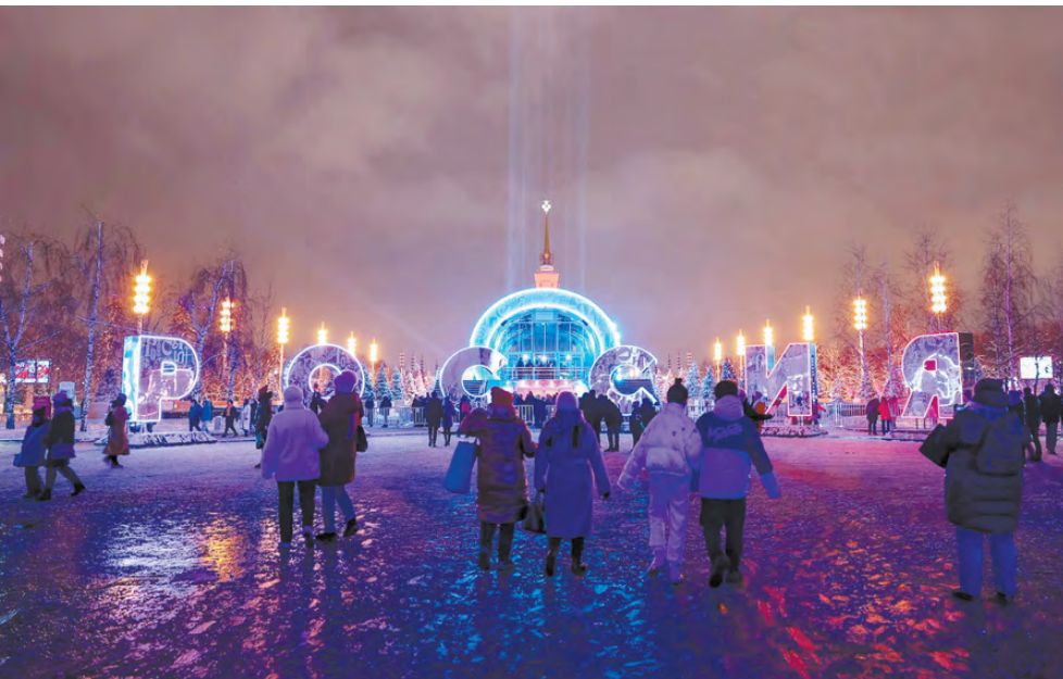
Вся Москва сияет!