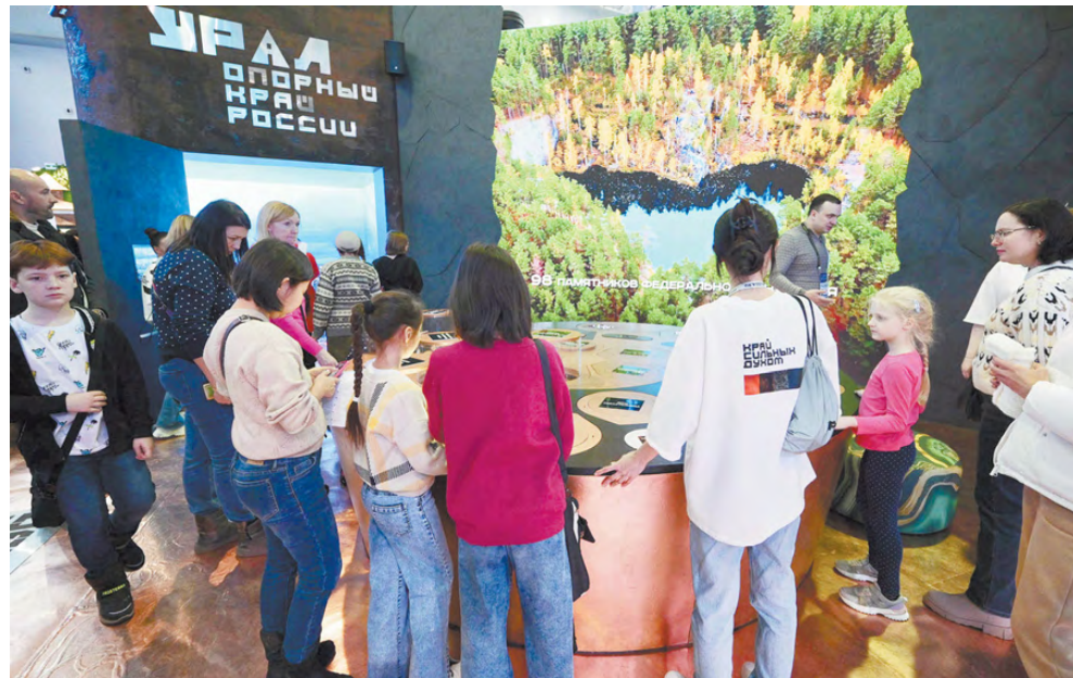
В павильоне выставки «Россия».