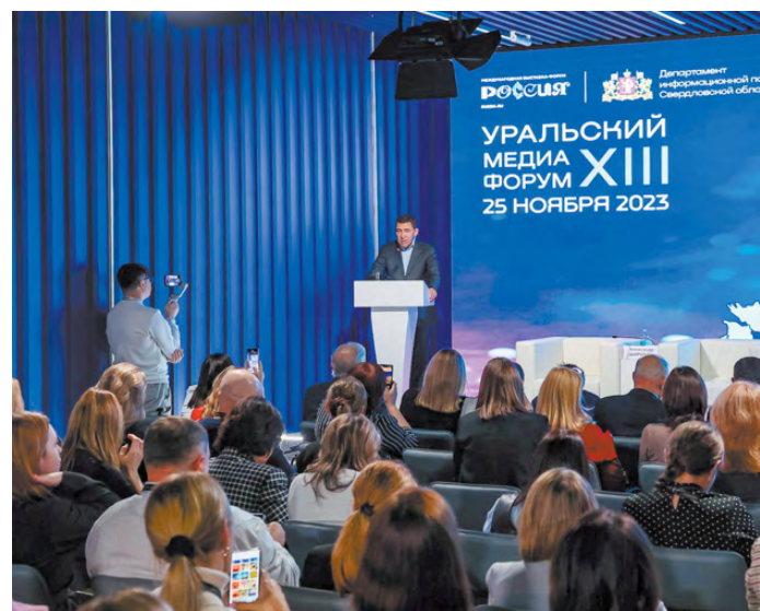
Евгений Куйвашев приветствует участников Уральского медиафорума.

Площадками для проведения Уральского медиафорума стали залы ВДНХ и гостиницы «Космос». Насыщенная культурно-развлекательная программа добавила ярких эмоций его участникам.