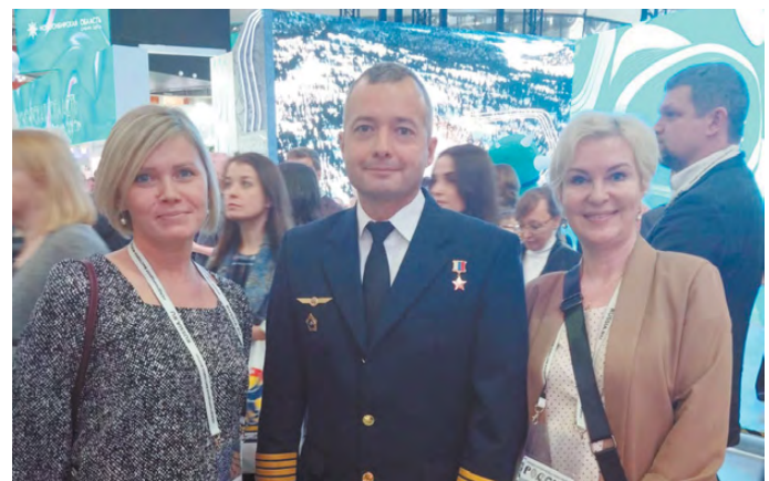
У стенда Свердловской области с Героем России Дамиром Юсуповым.