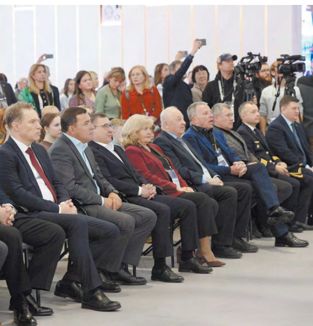
Делегация нашего региона на церемонии открытия Дня Свердловской области.