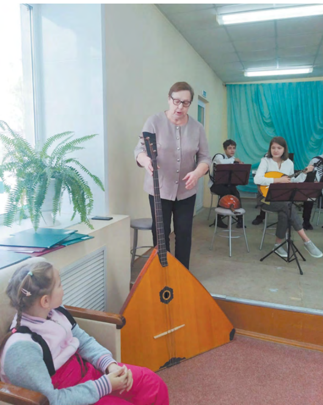
Самая большая балалайка-контрабас.

Дошкольники, воспитатели и родители слушали в исполнении оркестра и русские народные песни, и классическую музыку. В заключение путешествия весь зал стал «оркестром ладошек».