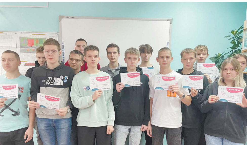
Этнографический диктант написали студенты РПТ.

Сотни уральцев в восьмой раз присоединились к ежегодной международной акции Большой этнографический диктант. Среди них – студенты Режевского политехникума и школьники образовательных учреждений района. Они писали диктант и получили свои сертификаты.