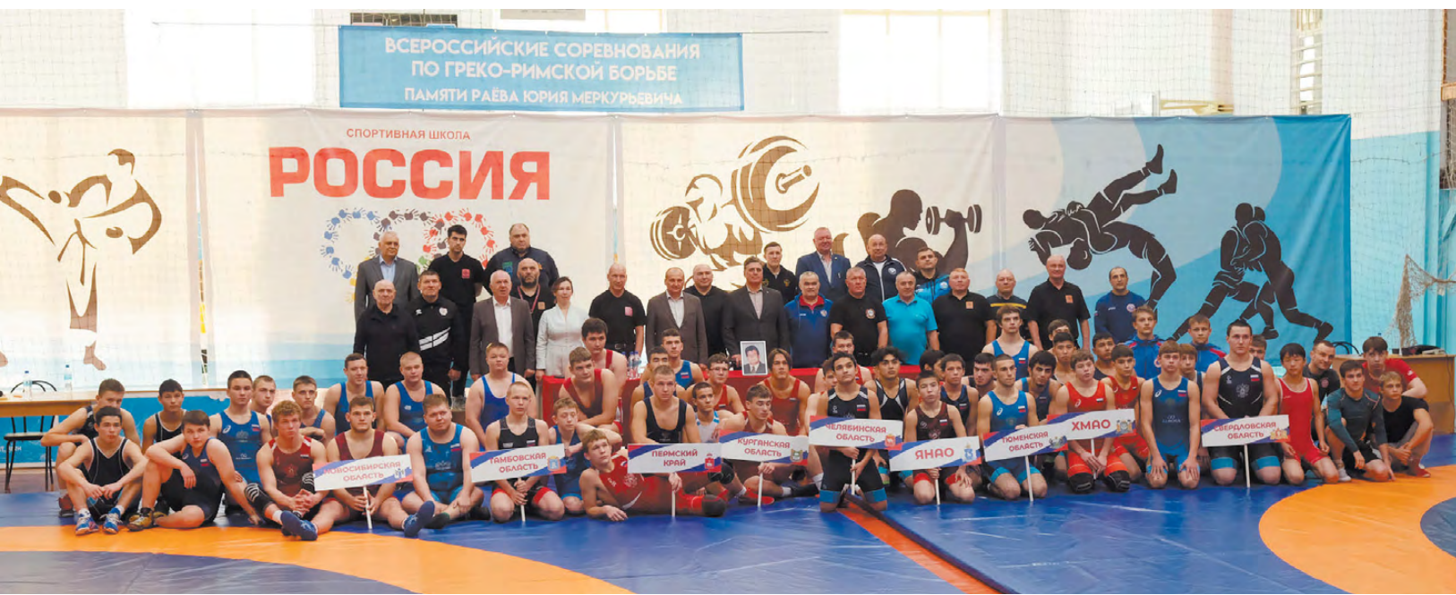
Участники всероссийского турнира.