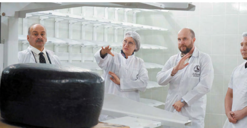
В производственном цехе «Доброй фермы».

«Поддержке аграриев уделяется в Свердловской области большое внимание. В настоящее время предусмотрены средства на развитие агротуризма», – сказала министр. И в планах «Доброй фермы» – развивать это направление.