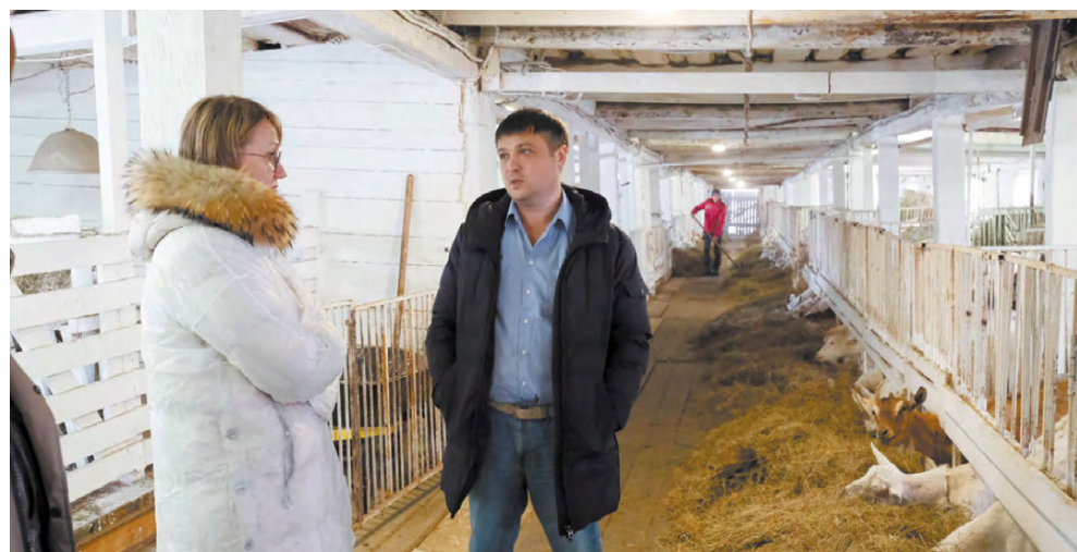
Стадо коз постоянно увеличивается.