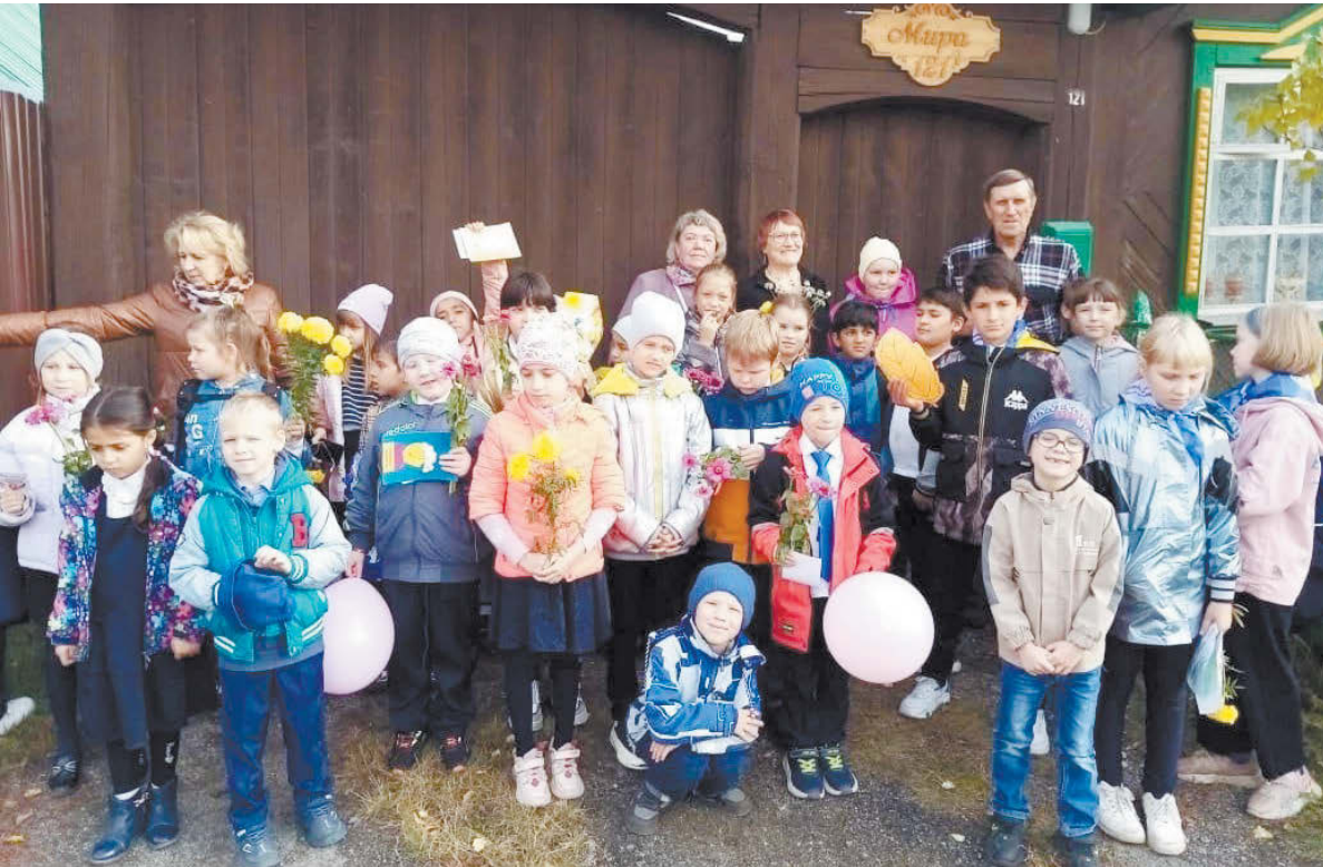
Баба, деда! Выходите, мы пришли вас поздравить!

Следующим мероприятием стал конкурс «Бабушка-2023», который зрители смотрели с интересом, поддерживая участниц конкурса и их болельщиков: детей и внуков. В библиотеке проводились мероприятия с детьми и их бабушками. А в один из дней к нам домой забежал внук, учащийся в 4-м классе школы №8, с криком: «Баба, деда! Выходите, мы пришли вас поздравить!» Около ворот стояли ученики младших классов со своими учителями. Они поздравили нас и соседей пенсионеров с Днём пожилых людей. Звучали стихи, поздравления, приятно было получить в подарок букетики полевых цветов из рук малышей. Было очень необычно, но очень приятно. Хорошо, что учителя показывают детям, как нужно воспринимать этот праздник. Ведь старикам приятно, когда их дети, внуки, правнуки звонят в этот день, приезжают, оставляя все дела и посвящая вечер своим близким, отчему дому, семье.