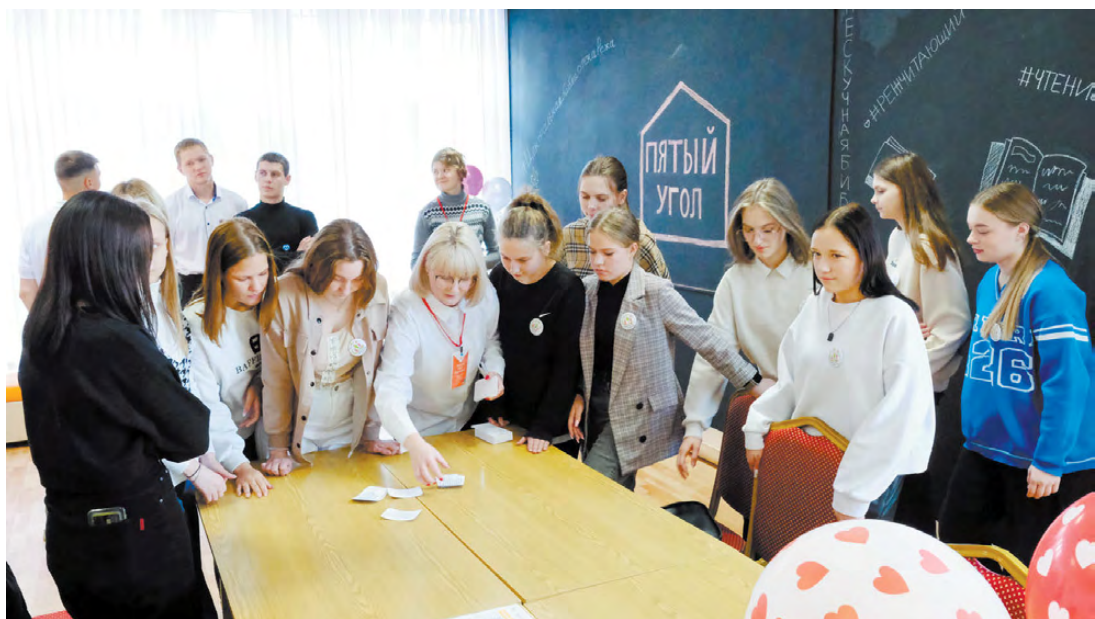
«Пятый угол» – это бесплатное место для встреч или отдыха.

«На данный момент коворкинг-пространство – это новый этап в развитии библиотеки. Мы хотим привлекать молодежь и работать с ней, сотрудничать. Ведь библиотека работает в разных направлениях. Но главные цели – культурное просвещение, знания и здоровьесбережение», – говорит Софья.