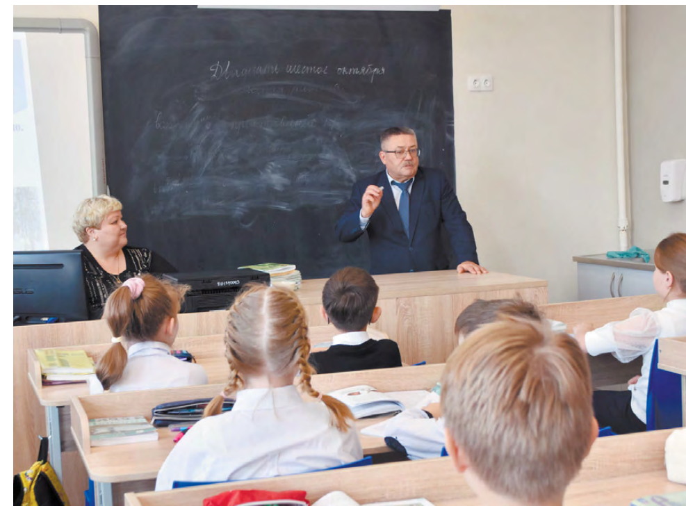
Ученики 5-го класса школы №3 поговорили с омбудсменом.

Одной из форм работы с несовершеннолетними Уполномоченный по правам