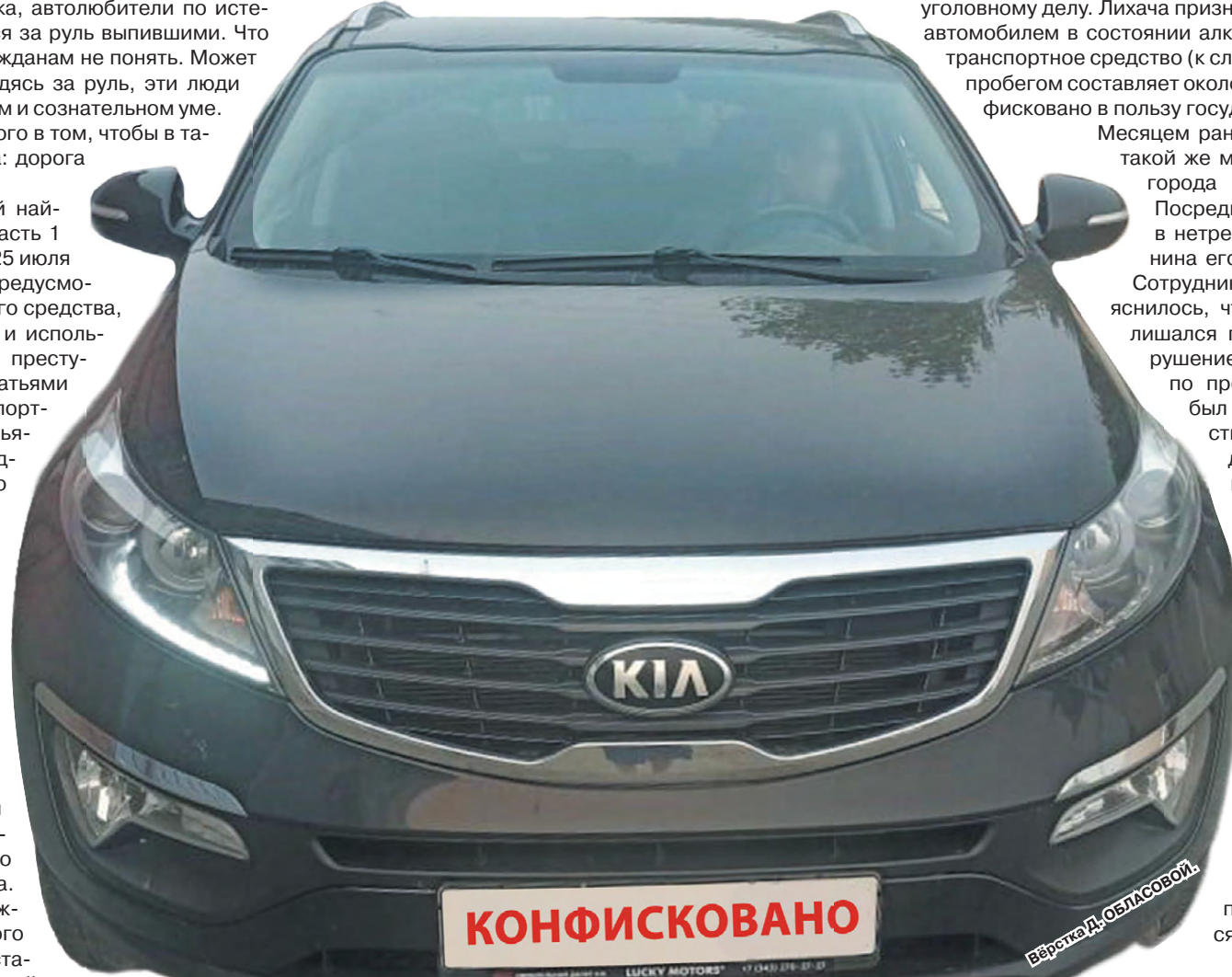
Вёрстка Д. ОБЛАСОВОЙ

Мы рассказали нашим читателям только о двух историях, но, повторимся, их было четыре. Статистика неутешительная. Будем надеяться, что этот урок станет примером остальным водителям. И пьяными за руль они садиться не будут.