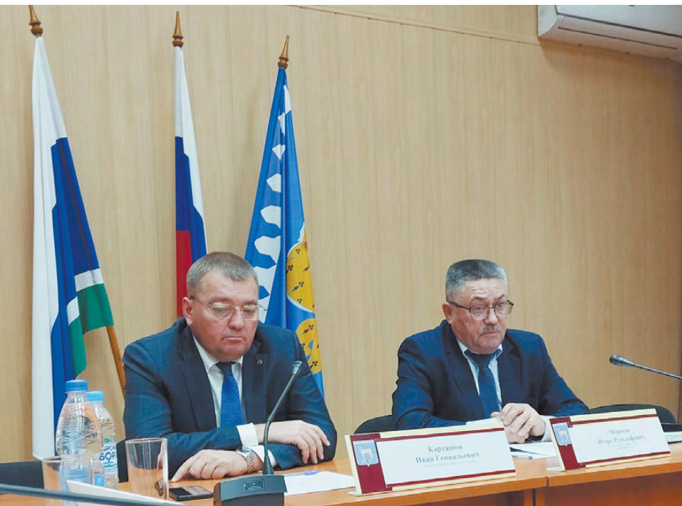
На встрече с Общественной палатой РГО.