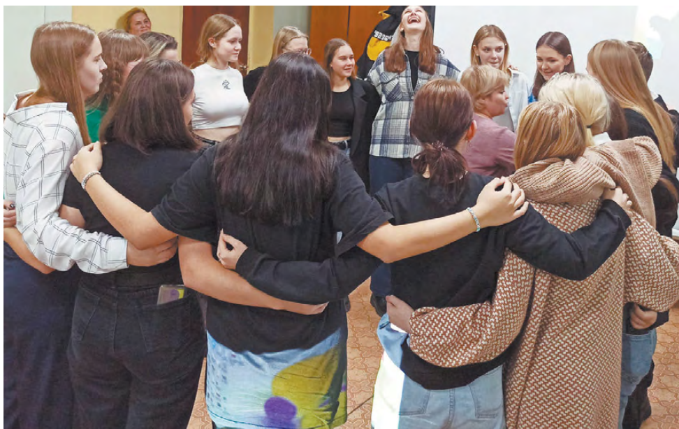
На первом заседании совета прошли игры на сплочение коллектива.

На первой встрече члены совета изучили характеристики и утвердили кандидатов в «Совет первых» Режевского городского округа. Ими стали активные и заинтере-