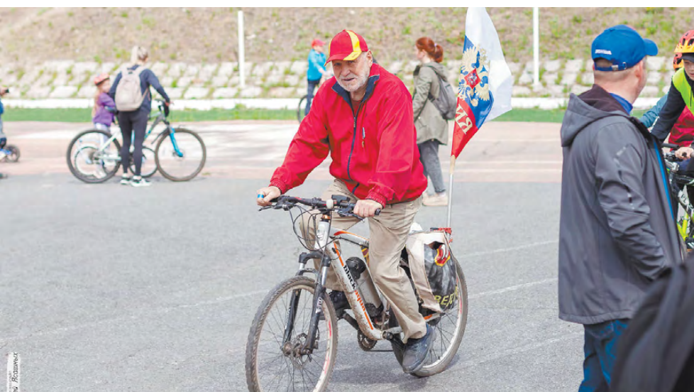
«Увидев меня на велосипеде, знакомые спрашивают: «Что, всё ездешь?» «Да, – отвечаю я, – всё живу!» (из книги Михаила Алексеевича).