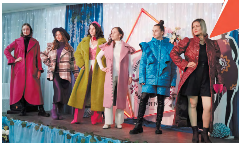
Показ моделей одежды в рамках фестиваля.