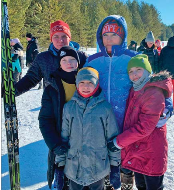
Динасовские лыжники с олимпийской чемпионкой Зинаидой Амосовой.

- Трасса в Красноуфимске непростая, с перепадами высоты, поэтому ребятам при-