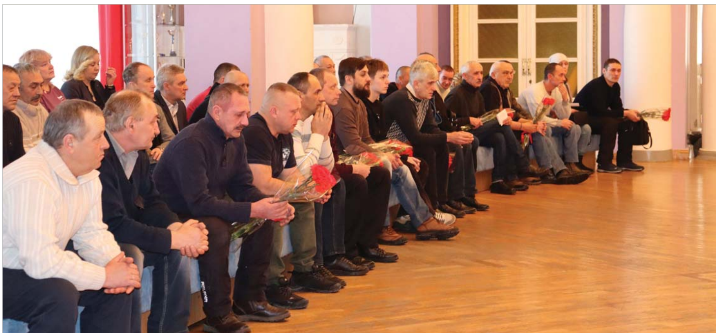
Заводчане – защитники Отечества.