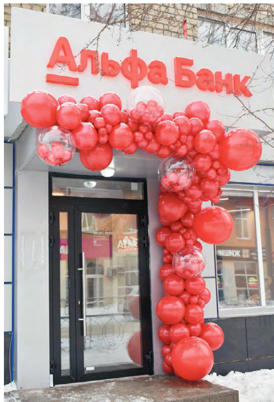
▲ Такой яркий вход трудно не заметить в самом центре города

Альфа-Банк – один из самых успешных российских банков,