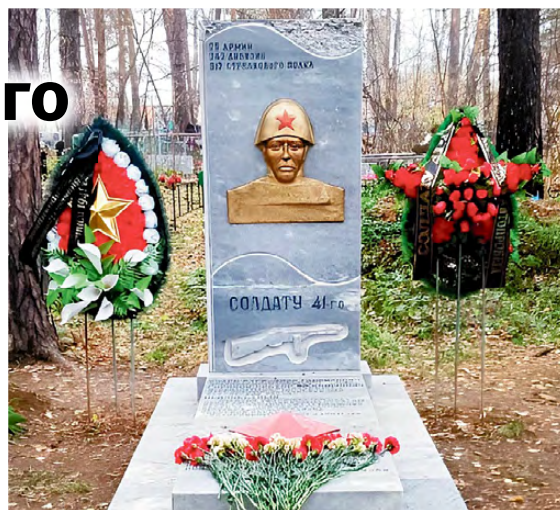
▲ Солдату 41-го. 70-я армия, 243-я дивизия, 312-й стрелковый полк

Людмила МАТВЕЕВА Снимки предоставлены автором