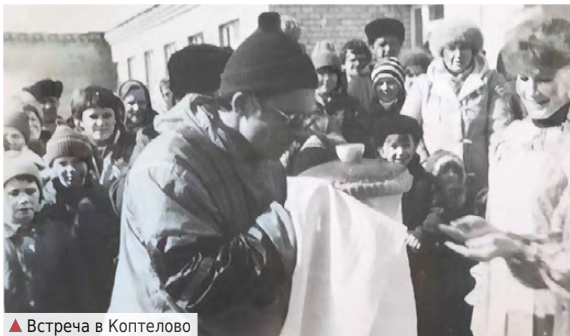
▲ Встреча в Коптелово

Это было мое первое путешествие до Арамашево».