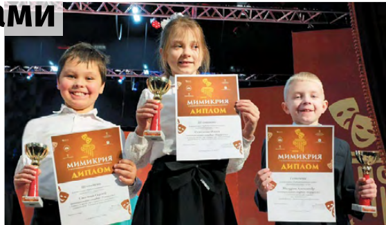
▲ Юные дипломанты конкурса «Мимикрия-2024»

26-28 января ирбитский Дворец культуры им. В.К. Костевича гостеприимно распахнул двери для всех участников VIII Областного конкурса малых форм театрального искусства «Мимикрия-2024».