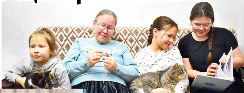
▲ Вечерние посиделки за вязанием и чтением

Никто из нас в детстве не может предугадать, как сложится его дальнейшая жизнь и какие в ней роли придется играть – поэта, художника, учителя или врача... Но определяющей в жизни каждого человека является роль семьи. И эту главную роль невозможно сыграть, ее нужно прожить... Не случайно 2024 год президентом страны объявлен Годом семьи. Только она является крепкой опорой государства и общества.