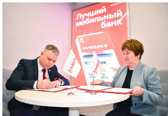
▲ Глава города подписывает соглашение о сотрудничестве

бренд которого известен всей стране. В его офисах работает настоящая команда амбициозных профессионалов, готовых решить любые вопросы клиента.