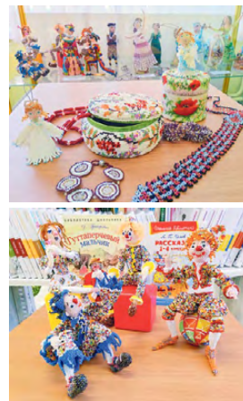
▲ Авторские работы

сельный клоун. Все свои изделия она творит в технике кирпичного плетения, плетёт вдохновенно, не имея готовых схем, и каждая работа – это воплощение её богатой фантазии. Самое главное, что все задуманное мастерица доводит до конца, оттачивая детали до совершенства.