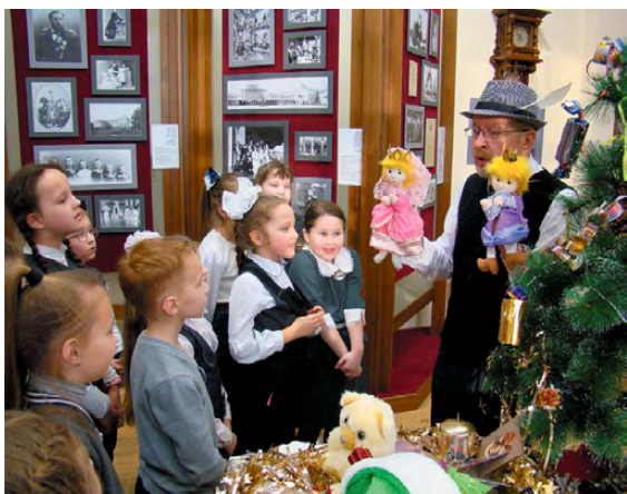
▲ «Рождество у Константиновичей»