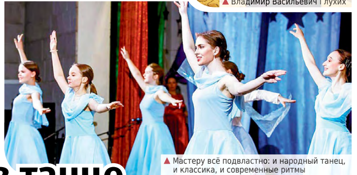
▲ Мастеру всё подвластно: и народный танец, и классика, и современные ритмы