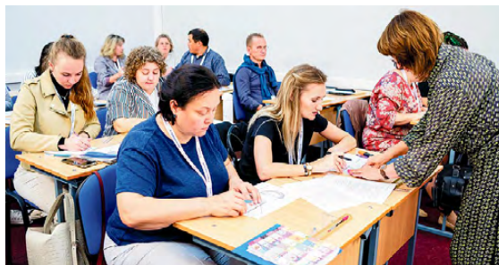
▲ Семинар-практикум «Сломанные инструменты», на котором педагогам было дано задание работать сломанными геометрическими инструментами: линейкой, транспортиром, угольником. Непросто, но интересно!

пускников средних школ, вузов и требований работодателей.