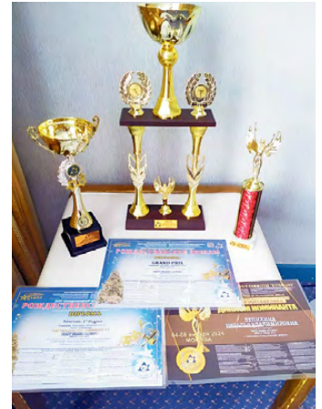
Родительское сообщество

диум» (г. Екатеринбург), «Планета искусств» (г. Москва, г. Сочи), «Шар к успеху» (г. В.Пышма). Каждое выступление всегда было высоко оценено жюри, и коллектив получал призовые места. Поездка в Москву на конкурс «Рождественские звезды» была очень насыщенной и тоже стала незабываемой.