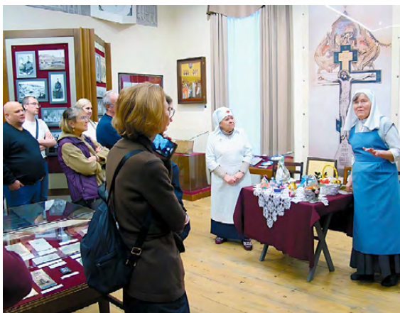
▲ Какие плодотворные дни!