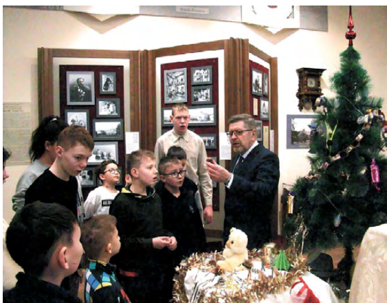
▲ Праздник для детей, оставшихся без попечения родителей