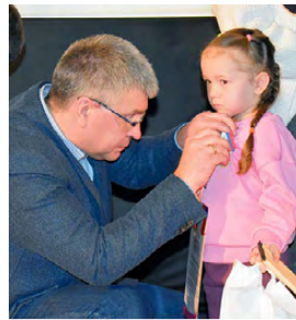
▲ Самые трогательные моменты, когда взрослые и дети были на одном уровне!