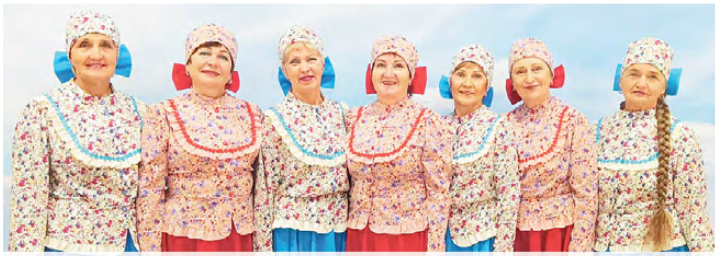
▲ На областном этапе фестиваля творчества ветеранов «Осеннее очарование»