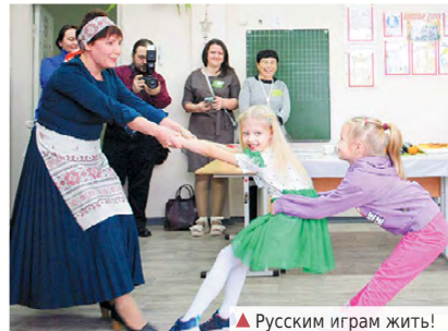
▲ Русским играм жить!

После чего все семь команд вместе с детскими родителями по ауриториям. Буквально через несколько минут каждая из семи классов команд наполнилась своеобразной деятельностью: где-то начали со сценко, у других начались весёлые забавы. А после игровых программ дети дружно расселись за столы, где для них уже были заготовлены материалы для мастер-классов с рождественской тематикой. В каждой сказочной мастерской создавалось чудо-чудесное: то веночек, то ангелочек, где оберег, а где и коза рогатая, смешная да бодатая!