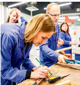
▲ Создание модели маятника часов в мастерской