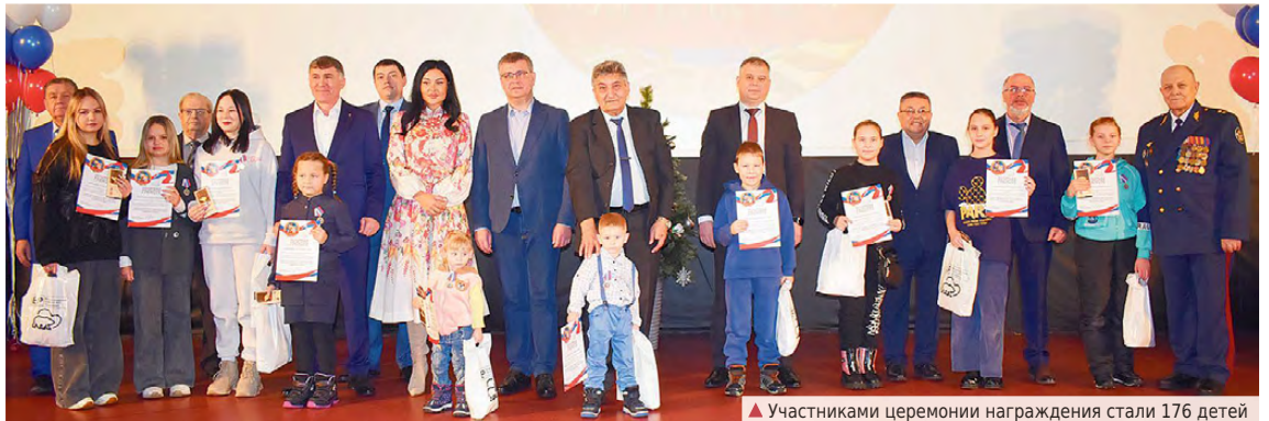
▲ Участниками церемонии награждения стали 176 детей