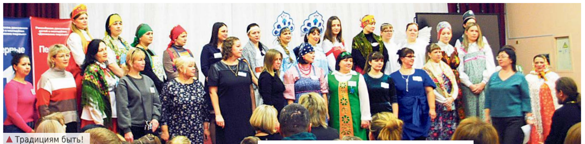
▲ Традициям быть!

Торжественное открытие фестиваля прошло в актовом зале школы, который был заполнен нарядно одетыми детьми и сопровождавшими их взрослыми. Причем взрослая часть заметно отличалась – многие женщины были одеты в красивые народные костюмы, и в этом чувствовалась подготовка к празднику, особое отношение к событию.