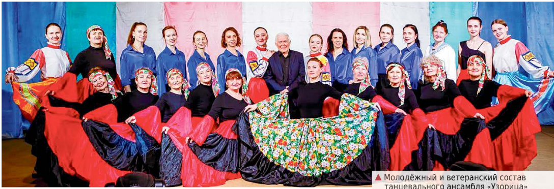
▲ Молодёжный и ветеранский состав танцевального ансамбля «Узорица»