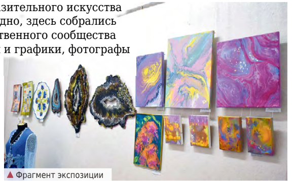
▲ Фрагмент экспозиции