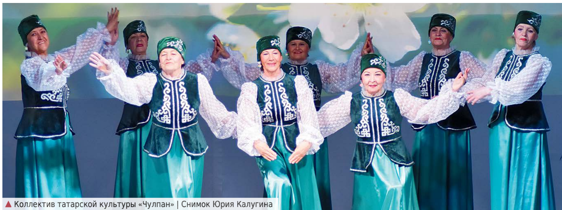
▲ Коллектив татарской культуры «Чулпан»