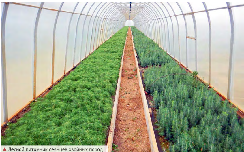
▲ Лесной питомник семян хвойных пород

ООО «Лестех» – одно из крупнейших в Свердловской области предприятий полного цикла по заготовке и переработке круглых лесоматериалов. В сегодняшней публикации мы расскажем об одном из направлений деятельности предприятия – работе с лесным фондом. Лес – наше богатство, и «Лестех» в своей практике применяет правило единого подхода к сохранению природных ресурсов.