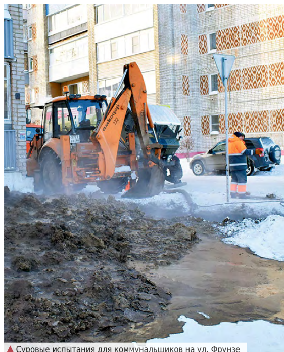
▲ Суровые испытания для коммунальщиков на ул. Фрунзе