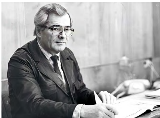
▲ Директор ИМЕТ УНЦ АН СССР чл.-корр. АН СССР Н.А. Ватолин в своем рабочем кабинете (1980 г.)

Его выдающийся вклад в неорганическую химию, физико-химический анализ металлов и шлаков, обширная научная и научно-организационная деятельность были высоко оценены правительством