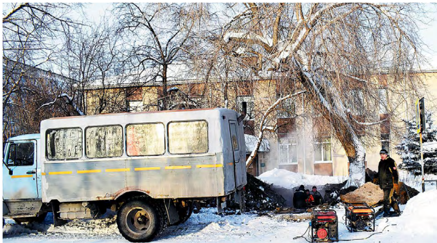
▲ Порыв на теплосети общежития медицинского колледжа