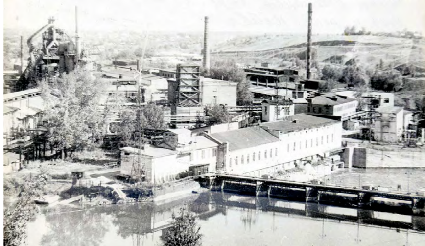
▲ На снимке Ф. Бодуэна панорама АМЗ, плотина, электроподстанция, слева домна, справа прокатные цеха, на переднем плане пруд и река Нейва. 1950-е годы

Подготовлено по материалам А. РЕМПЕЛЯ, директора ИМЕТ УрО РАН