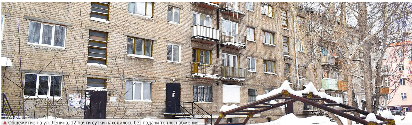
▲ Общежитие на ул. Ленина, 12 почти сутки находилось без подачи теплоснабжения

Незапланированные рабочие будни, причём в аварийном режиме, для алапаевских коммунальщиков начались уже со второго января. За праздничную неделю на городских теплотрассах произошло несколько серьёзных аварий, в результате которых кто-то отмечал праздники без воды, а кто-то в холодных стенах.