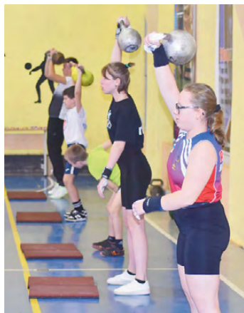
▲ Яркие моменты соревнований