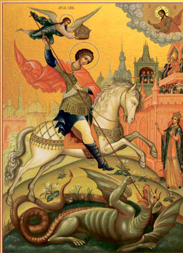
Икона Георгий Победоносец великомученик