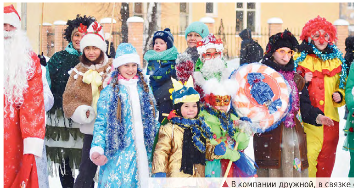
▲ В компании дружной, в связке семейной – незабываемый праздник!