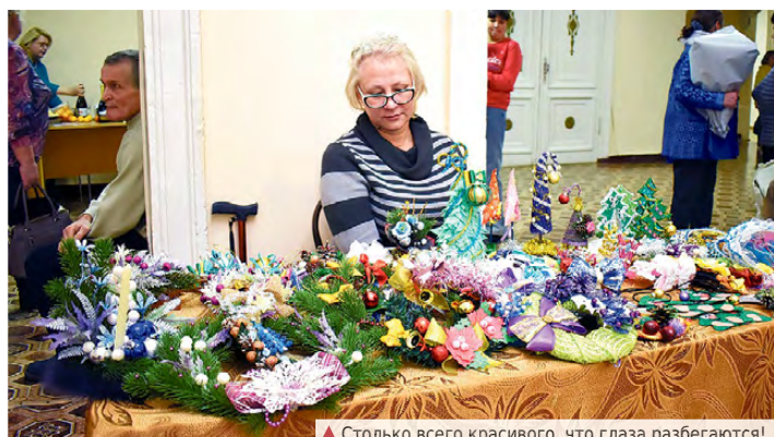
▲ Столько всего красивого, что глаза разбегаются!

мир счастья, улыбок, тепла и уюта, среди которых не будет места печали и разочарованию... Согласитесь, что Новый год – это пора чудес!