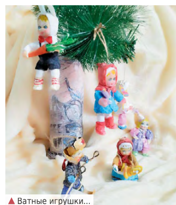
▲ Ватные игрушки...