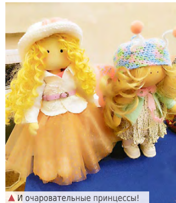
▲ И очаровательные принцессы!

Пусть будущий год станет для нас началом чего-то нового и прекрасного. Пусть подарит всё то, о чём каждый из нас мечтает. Пусть он откроет двери в чудесный