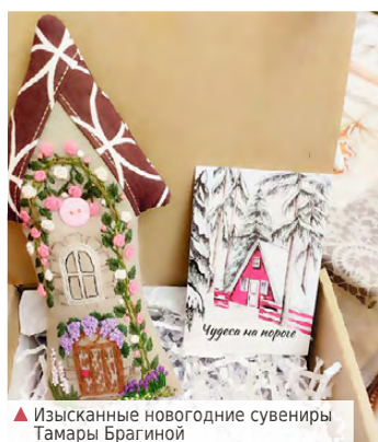
▲ Изысканные новогодние сувениры Тамары Брагиной