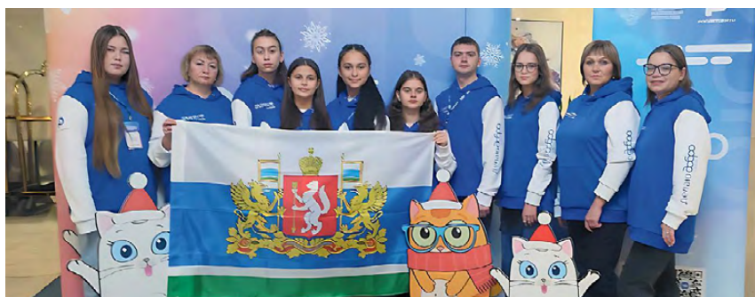
▲ Военно-патриотический отряд «Высота» школы № 2

Центр общения старшего поколения ул. Лесников, 7, каб. 203 Записаться и задать вопросы можно по телефонам: 8 (34346) 3-07-06, 8-912-22-48-862 9 января (ВТ) в 11:00 – Территория здоровья. Лекция: «Как сохранить волосы и кожу в пожилом возрасте». 10 января (СР) в 10:00 – Лечебно-физкультурная гимнастика.