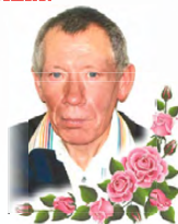
Жена, дочери и внуки

Муж дорогой, славный и милый, Папочка наш родной и любимый, Дедушка добрый, незаменимый, С днём рождения поздравляем, Чтобы ты никогда не болел, Чтобы ты никогда не старел, Чтобы вечно для нас ты был молодой Весёлым и нежным, добрым такой. За руки золотые, За отцовский твой совет Целуем мы славные добрые руки С любовью к тебе Жена, дочери и внуки!