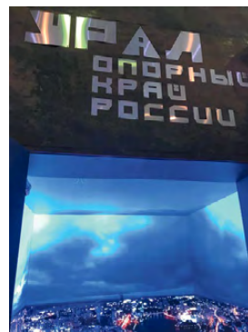
▲ На стенде Свердловской области

Надо подчеркнуть, что 75-й павильон ВДНХ – это крупнейшая экспозиция Международной выставки-форума «Россия», на которой представлены 89 регионов России. Побывать во всех уголках страны крайне сложно, а вот получить представление о нашей многонациональной стране можно имен-