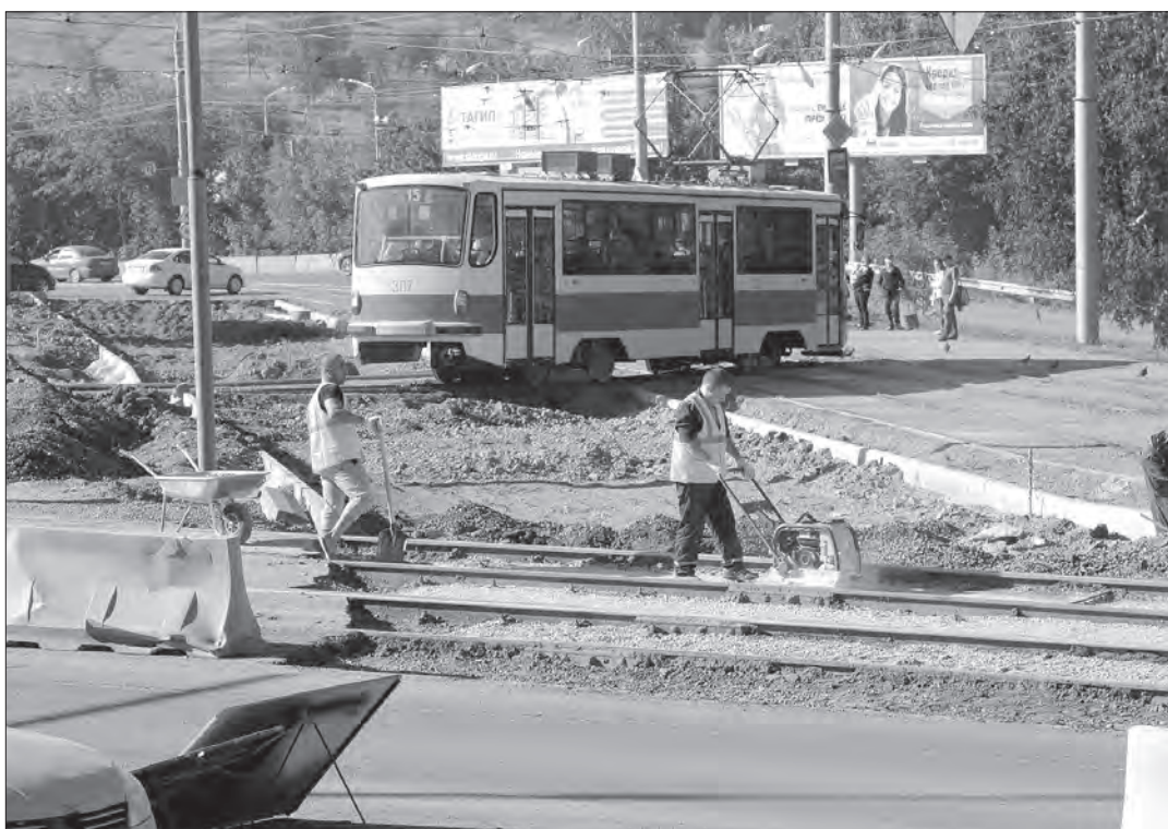
Работы не мешают движению трамваев.