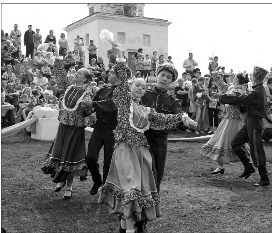
Выступление хореографического ансамбля «Родничок» на Лисьей горе.