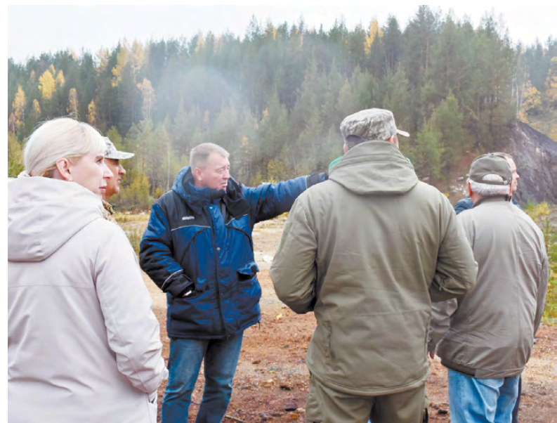
Заказник «Режевской» – красивейшее место для отдыха.

Для туристов на Липовском карьере (так режевляне привыкли называть это место) построены домики и беседки, обустраиваются маршруты, открываются всё новые объекты, ради которых туда хочется ехать. В ближайшие годы темп работ будет только нарастать. В планах организация отдыха для маломобильных групп населения, обустройство