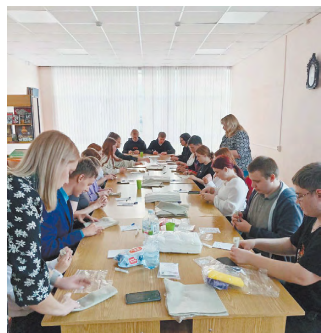
■ Процесс изготовления «сухого душа».

Оказывается, изготовить «сухой душ» несложно, и каждый присутствующий смог сделать по несколько таких, вложив в маленький пакетик и частичку своей души.