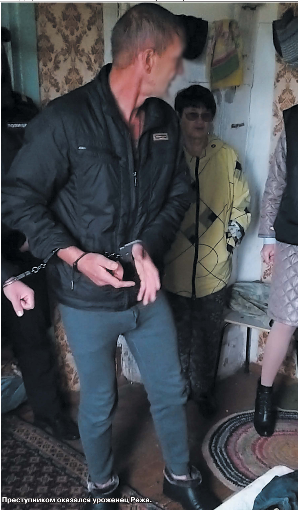
Преступником оказался уроженец Режа.