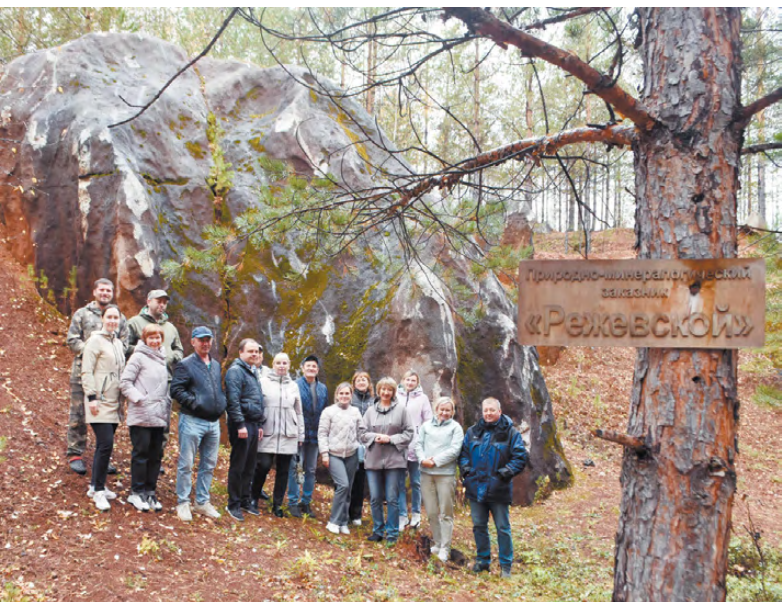
Участники мероприятия у камня Слон.