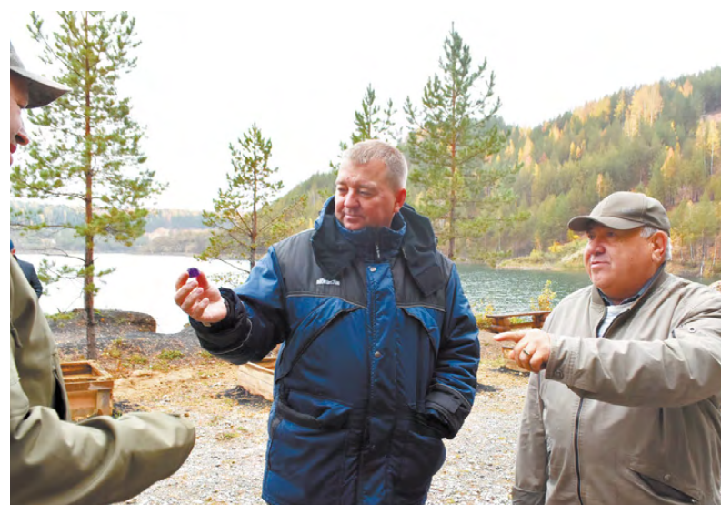
Режевская земля богата минералами.

территории хороший. Туда и так едут люди со всей страны полюбоваться на «изумрудное озеро», а с созданием туристической инфраструктуры Липовский парк станет одним из самых популярных мест у любителей отдыха на природе, в том числе активного.