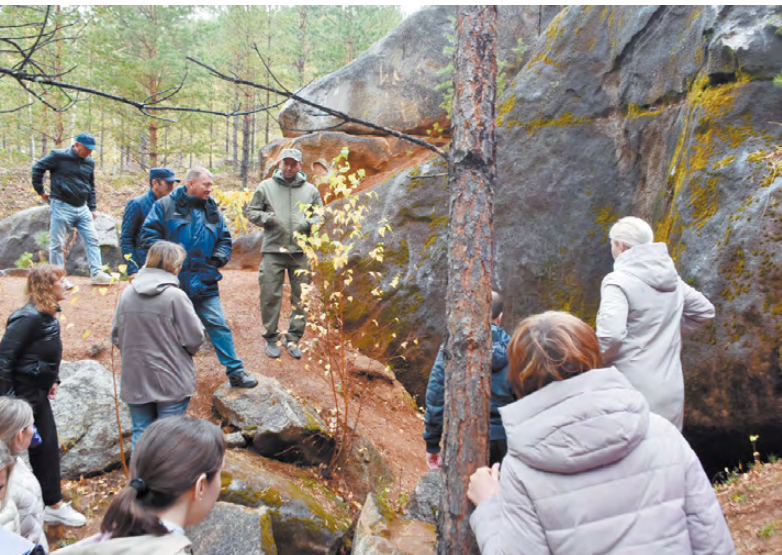
У входа в пещеру.

Уникальной красоты место в Липовском парке – это цветные глины. Это творение природы не оставляет равнодушным никого.