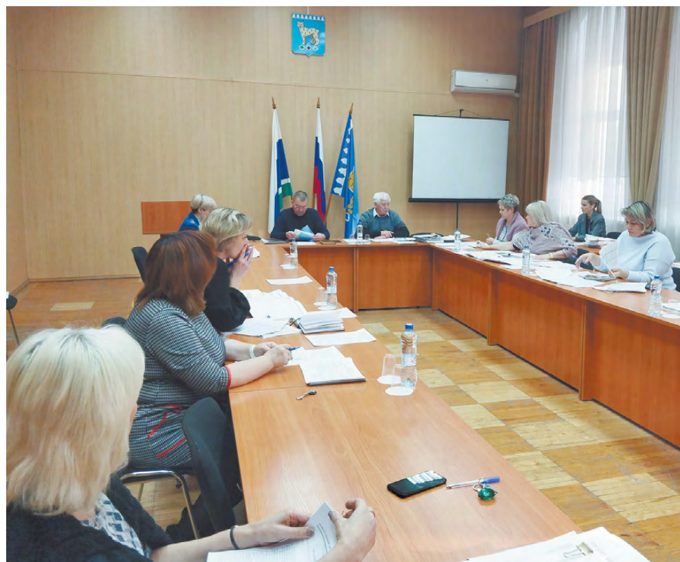
Заседание комиссии по экономике и бюджету: идёт рассмотрение расходной части главного финансового документа РГО.

Также в протоколе одного из заседаний депутатской комиссии по экономике и бюджету есть пункт, касающийся выделения помещения (либо модульного строительства) спортивной базы в с. Липовское. Администрации РГО также предстоит провести большую работу, чтобы такой объект