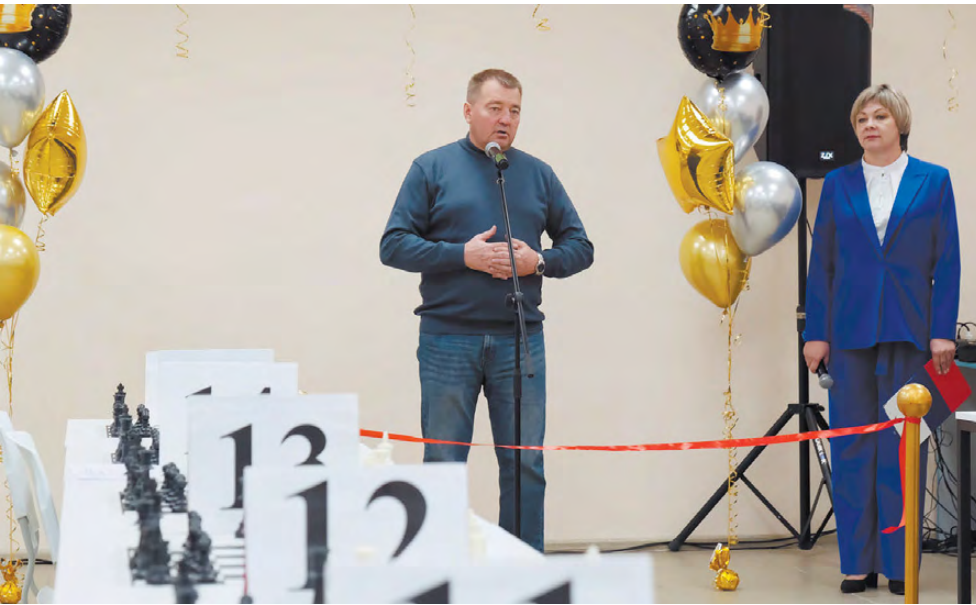
Глава РГО «запустил» новый «дом шахмат»!

История шахмат насчитывает не менее полутора тысяч лет, но в них продолжают вовлекаться и мальчишки, и девчонки всего Режевского района. Немалая роль в этом принадлежит педагогам и энтузиастам этого спорта.