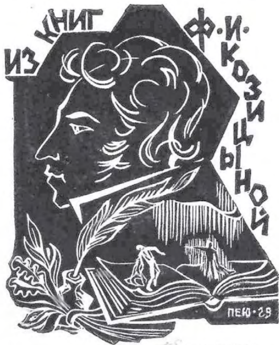
Пушкинский экслибрис из собрания Исторического музея Режа.