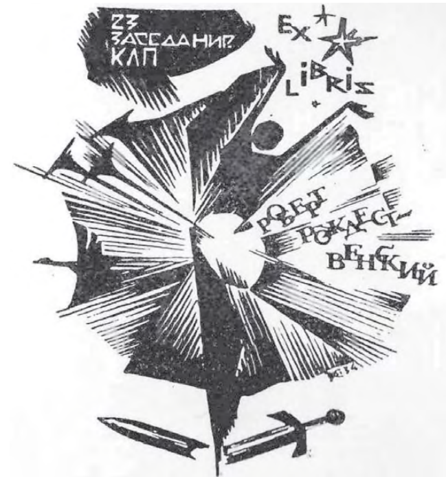
Экслибрис, посвященный творчеству поэта Роберта Рождественского, из собрания Исторического музея Режа.

Также на экслибрисе изображены птицы, рвущиеся в самую высь, – строчки Рождественского-максималиста. Сам поэт признался однажды: «Я не верю стихам, которые льются. Рвутся – да!» Рождественский чутко ловил «сигналы» времени, другими еще не слышанные. «Рвущиеся» строки – без срока давности. Прочитайте любой его сборник, хотя бы и самый ранний, – стихи в нем написаны словно вчера.