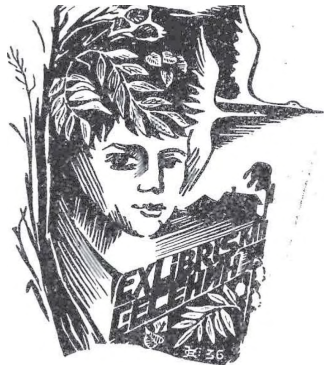
Есенинский экслибрис из собрания Исторического музея Режа.

В 40-х годах прошлого века график Теодорович выполнил первый есенинский экслибрис для поэта Сергея Головачева: под ночным созвездием гениальный рязанец прильнул к стволу березы. Некогда при жизни своей он подарил Головачеву-тезке фото с росчерком «Серёже маленькому от Серёжи большого». И Головачев, и Теодорович могли угодить на ныр: есенинское имя в то время жестко преследовалось. Но его стихи читали из-под полы, перенимая из рук в руки, будто сокровище. Слово Есенина