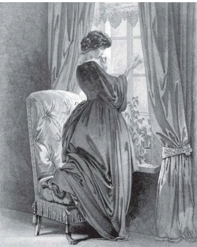
Первый пушкинский экслибрис А. Ф. Онегина (работа И. Песке). 80-е годы XIX века.

Пушкиниана – один из любимейших сюжетов у многих небезызвестных графиков: это ни много ни мало, а порядка 3 000 экслибрисов! Прежде всего, это копии с полотен Кипренского, Тропинина, пушкинские автопортреты, росчерки. Разумеется, и герои страниц произведений Пушкина. Так, образ Татьяны Лариной, героини «Евгения Онегина», украсил первый пушкинский экслибрис конца 80-х годов XIX века кисти гравера Песке.