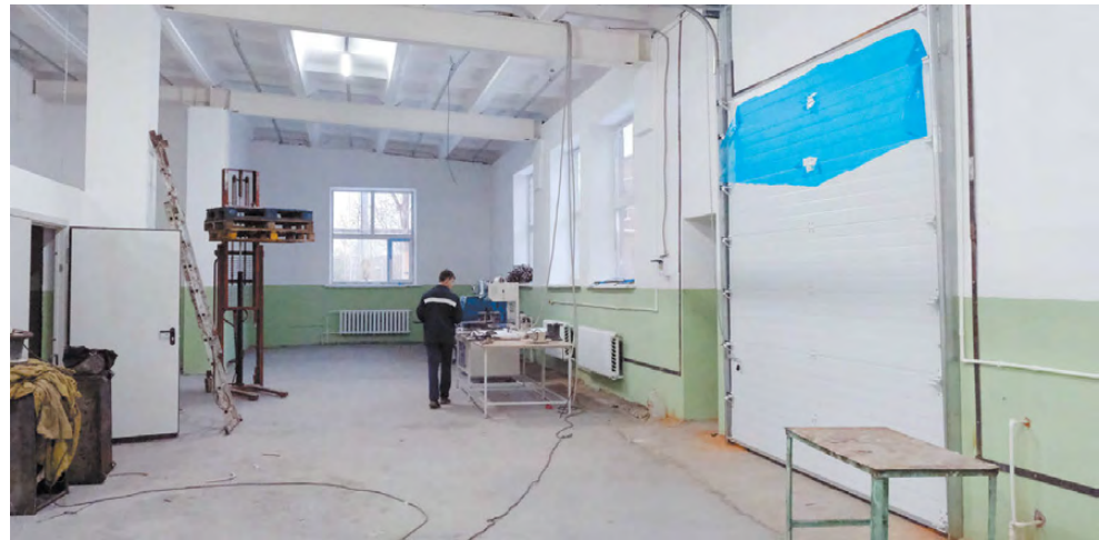
В этом цехе ничего не напоминает о пожаре.

Он напомнил, что в тот момент производство было полностью остановлено, а месячный запас складских остатков без-