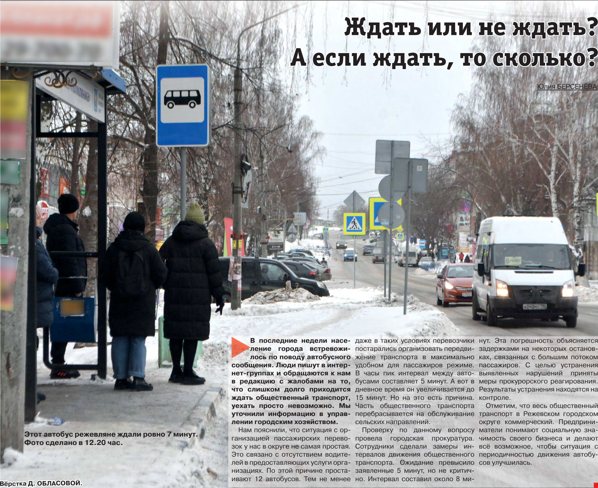
Этот автобус режевляне ждали ровно 7 минут. Фото сделано в 12.20 час.