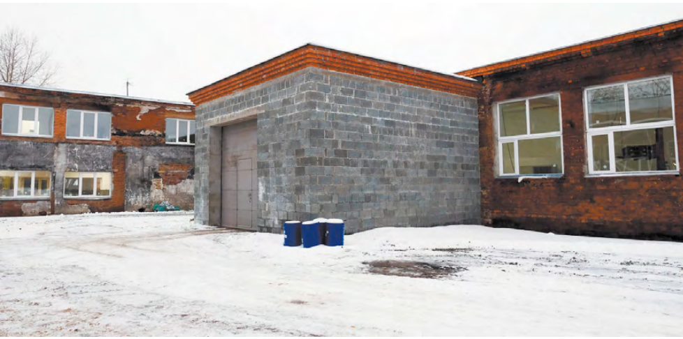
Восстановленное здание Режевского предприятия «ЭЛТИЗ».