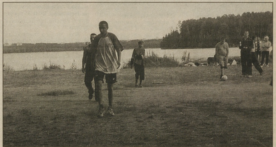
На снимках: в результате этих титанических усилий в перетягивании каната команда «СФС» заняла второе место; штрафной удар в сторону «Грандстрой» бьет футболист «Сантехмонтажа», в результате чего счет был «размочен».