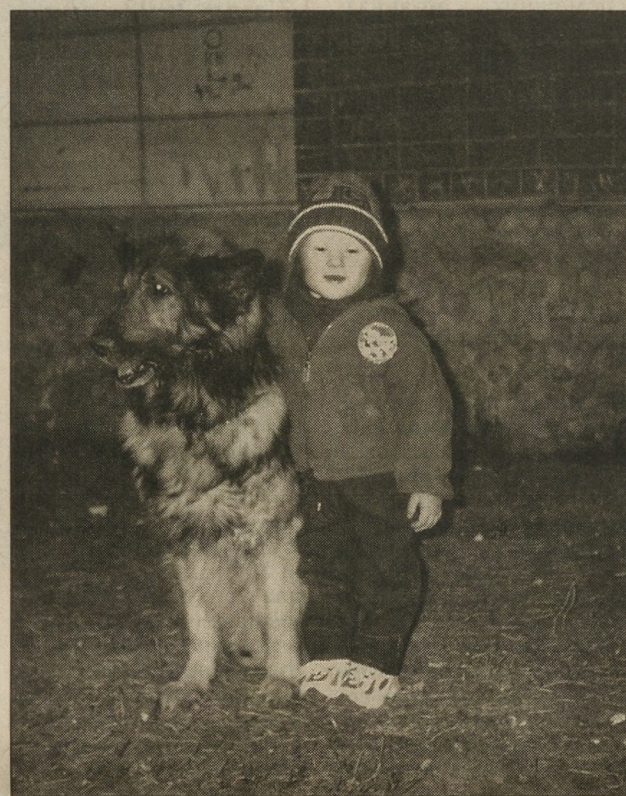
«А у меня есть верный друг по имени Грей».