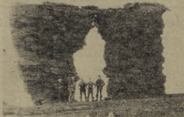
Природа покорна сильным и добрым. Всех, кто любит ее, приглашаем шагать неизведанными тропами.

Началась другая часть путешествия—водная. Соорудили добротный двадцатиметровый плот, поставили на нем палатку и отправились по течению притока Печоры до Приуральского лесозащитного участка. Здесь и закончился наш поход.