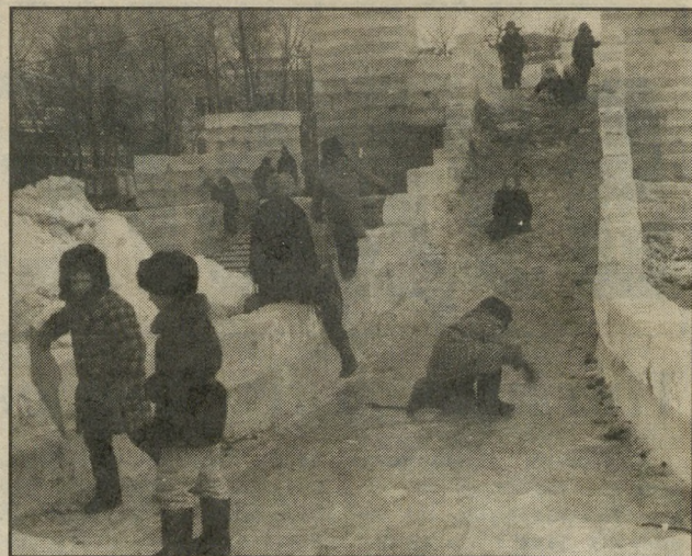
Хороша уральская зима!