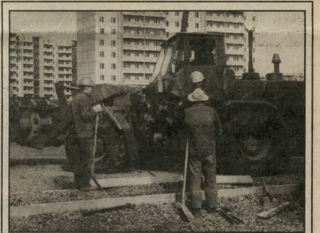
ДСК осваивает дорожное строительство...

В сфере эксплуатации жилья большой гирей на ЖКХ висит НДС. Это же неумно: государство дотирует ЖКХ, а потом отбирает деньги через НДС. Мы сейчас готовимся и в