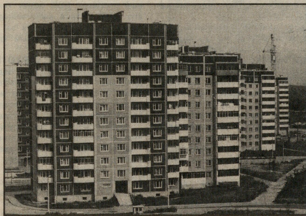
Микрорайон «Ботанический», 1996 год.

В ДСК вышел приказ генерального директора, в котором, на основании предписания главного управления