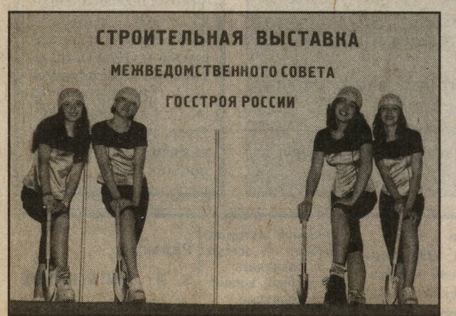
НА СНИМКЕ: участницы ансамбля «Соловушка».