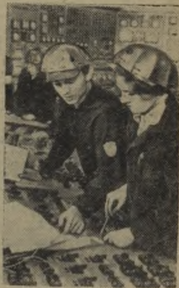
Тюменская область. На Сургутской ГРЭС — горячая пора. Полным ходом идет подготовка к пуску второго энергоблока мощностью 200 тысяч киловатт.

Сургутская ГРЭС — одна из крупнейших электростанций в стране и Европе, работающая на попутном нефтяном газе. Ее энергия передается на нефтяные промыслы, в города и поселки Западной Сибири.