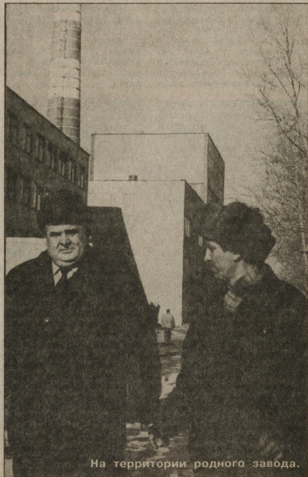
На территории родного завода.

(Из книги «Россия. Чкаловский район. Екатеринбург». Автор-составитель Н. К. Кулешов)