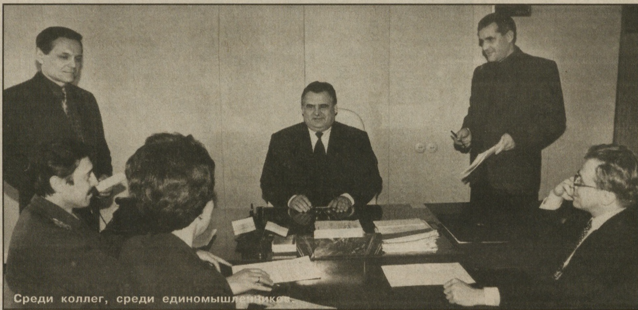
Среди коллег, среди единомышленников.