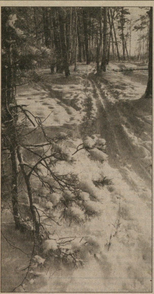
А лыжня зовет!

Акционеры ДСК, у которых в последнее время произошли изменения (смена места жительства, паспорта и др.)! К вам просьба: сообщить эти изменения в комбинат — нужно зайти в комн. № 30а (ул. Первомайская, 60) в любой день недели, кроме понедельника, с 10-00 до 17-00.