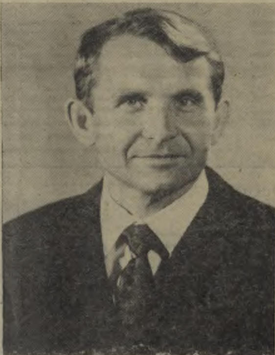
Командир космического корабля «Союз-12» Василий Григорьевич Лазарев. Борт-инженер космического корабля «Союз-12» Олег Григорьевич Макаров.