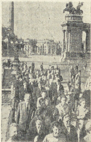
Группа советских туристов в Венгерской Народной Республике осматривает город Будапешт.

Как показали проведенные испытания, новый электротормоз позволяет крановщикам работать на больших скоростях. Принцип нового способа торможения заключается в том, что обычный электродвигатель, работающий на переменном токе, в необходимый момент переключается на питание от источника постоянного тока и превращается в тормоз. Новый тормоз обладает большими преимуществами по сравнению с известными механическими и электрическими тормозами.