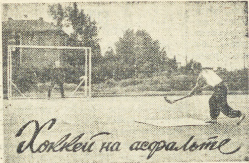
Хоккей на асфальте

Одна из сильнейших в стране команд по хоккею с мячом — команда Свердловского Дома офицеров активно готовится к предстоящему зимнему спортивному сезону.