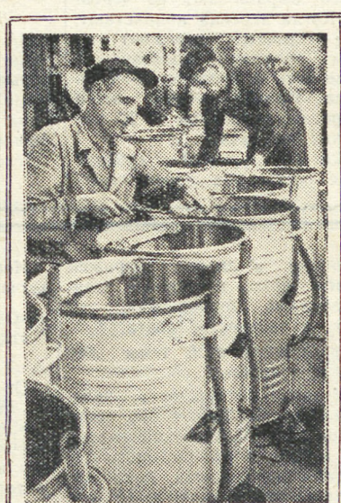
На заводе «Уралэлектроаппарат» участок сборки стиральных машин цеха товаров народного потребления переведен на точный метод работы. Здесь произведена переустановка оборудования и разработана новая технология сборки. Это позволило сократить число рабочих более чем на 30 процентов и значительно повысить производительность труда.

В воскресенье, 28 августа, свердловские команды ДСО «Авангард» и Дома офицеров встречаются между собой.