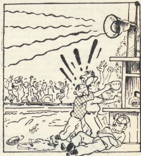
Рис. Г. Ляхина.

Вечером в парке, кроме танцев, ничего нет. Но больше некуда идти. Правда, есть в поселке Дом культуры железнодорожников и клуб, но, чтобы посмотреть там кино, нужно несколько часов стоять за билетами. А работники парка, почти все работающие по совместительству, видимо, не имеют желания придумать над тем,