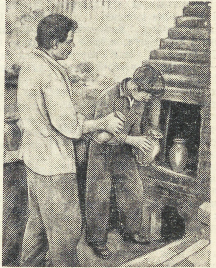
Вот она, гончарная печь «Пионерка»