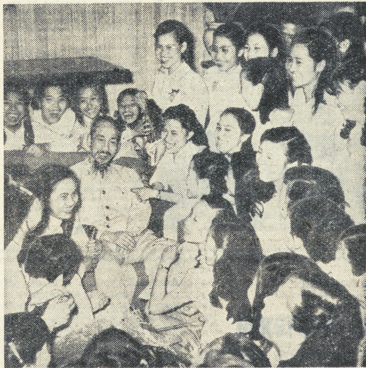
Демократическая Республика Вьетнам. Президент республики Хо Ши Мин среди школьников, которые пришли поздравить его с 65-летием.

речащих Уставу Организации Объединенных Наций. Ассамблея одобрила предложение о необходимости заложить основы всеобщей коллективной безопасности в Европе. В ходе дискуссии по вопросу безопасности в Азии участники Ассамблеи единодушно высказались за предоставление Китайской Народной Республике ее законного места в Организации Объединенных Наций, за соблюдение Женевских соглашений об Индо-Китае, за возвращение КНР острова Тайвань.