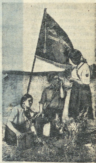
Чкаловцы установили связь с городским штабом.

Но что это? Призывно звучит горн. В лесу расположился кукольный театр Дворца пионеров. Он начинает спектакль