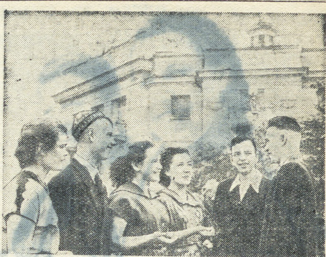
В свой выходной день 21 июня около полутора тысяч молодых рабочих Первоуральского новотрубнового завода приехали в Свердловск, чтобы посмотреть спектакль Московского Художественного академического театра «Сердце не прощает». НА СНИМКЕ: молодые рабочие Первоуральска после спектакля делятся своими впечатлениями.