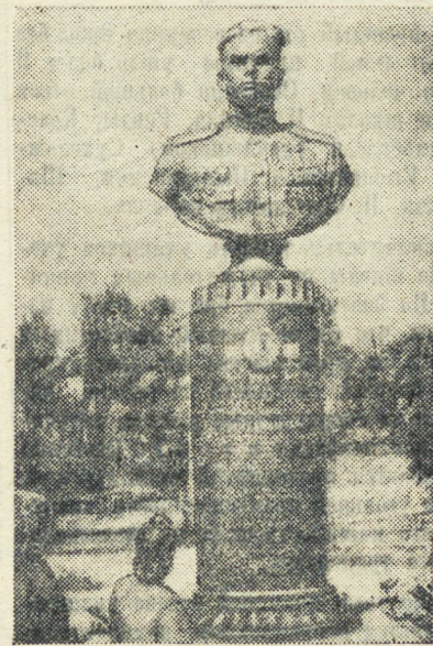
Ворошиловградская область. Бюст дважды Героя Советского Союза гвардии старшего лейтенанта Ивана Харитоновича Михайличенко, установленный в поселке Алмазная.

Всего в колхозах области за прошедшее полугодие установлено более 3.000 радиоприемников. Большинство их изготовлено молодыми радиолюбителями.