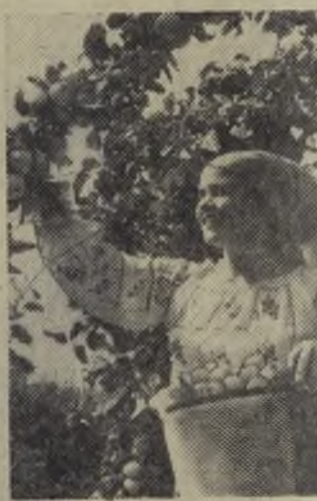
Молдавская ССР. Колхозы и совхозы Новоаненского района отправляют абрикосы и персики в Москву, Ленинград, Ригу, Новосибирск и другие промышленные центры страны.

До конца сезона объединение «Молдплодоовощпром» поставит трудящимся центральных и северных областей страны свыше 450 тысяч тонн фруктов, винограда, овощей.