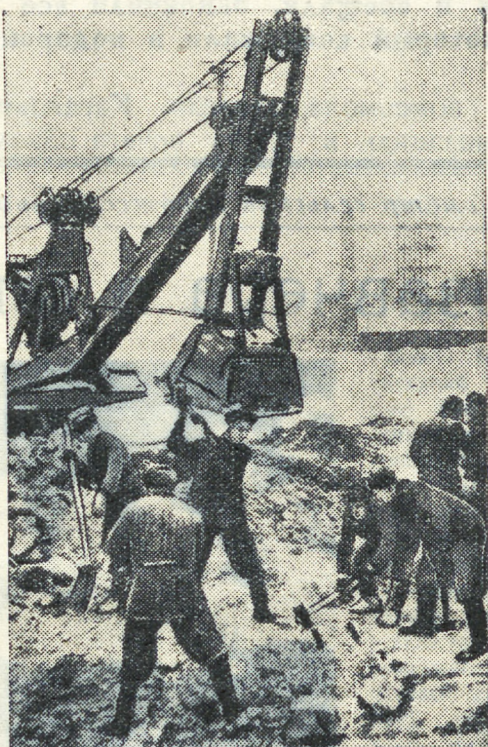
Комсомольцы завода имени Серова разбивают мерзлый грунт.