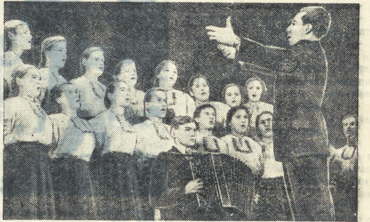
Выступает вокальный ансамбль Верхне-Тавдинского районного Дома культуры.

...На фоне Уральских гор и озер — коллектив Краснофимского районного Дома культуры.