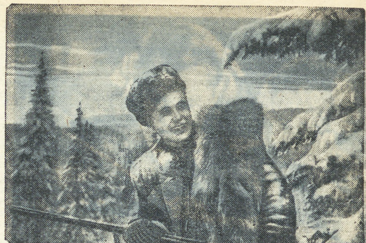
МОЛОДОЙ ОХОТНИК.