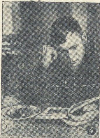
Текст И. Пешковой.

Наверняка хорошо проведут свои каникулы и другие учащиеся в студенты. А пока, в последние дни сессии, им остается пожелать бодрости, хорошего настроения, отличных результатов в зачетной книжке.