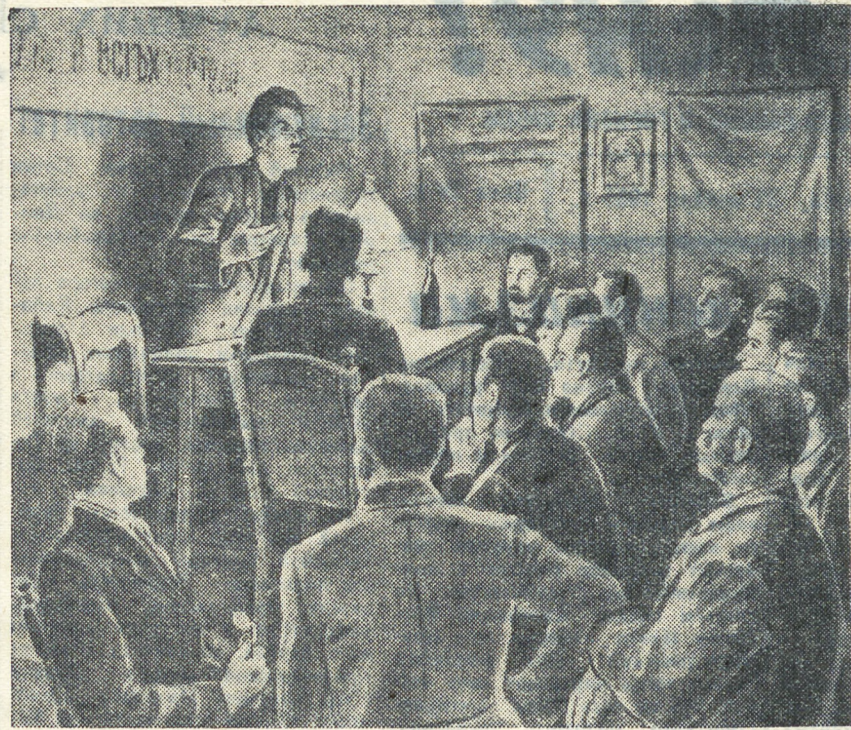
Расстрел царскими войсками рабочих Петербурга 9 января 1905 года вызвал всеобщее возмущение и негодование. Большевистские организации уральских заводов и городов приступили к организации революционной борьбы. Были выпущены листовки и прокламации по поводу кровавых злодеяний царя. На заводах прошли митинги протеста, начались забастовки.

Миллионы советских юношей и девушек, изучая героическую историю Коммунистической партии, в эти дни вновь и вновь обращаются к овеянным славой страницам, повествующим о легендарных боях российского пролетариата в незабываемом 1905 году.